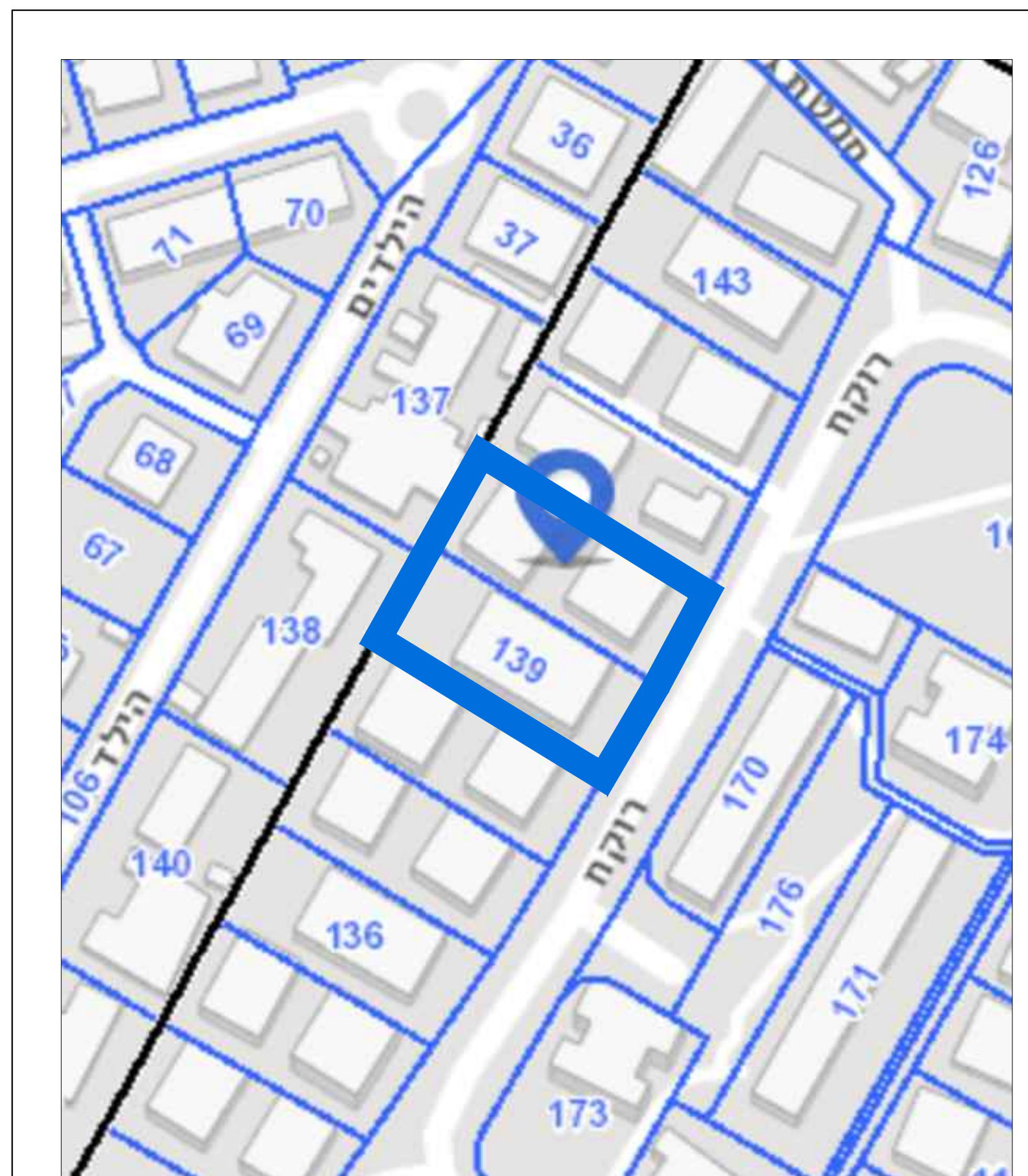
תרשים סביבה קנ"מ 1:1000