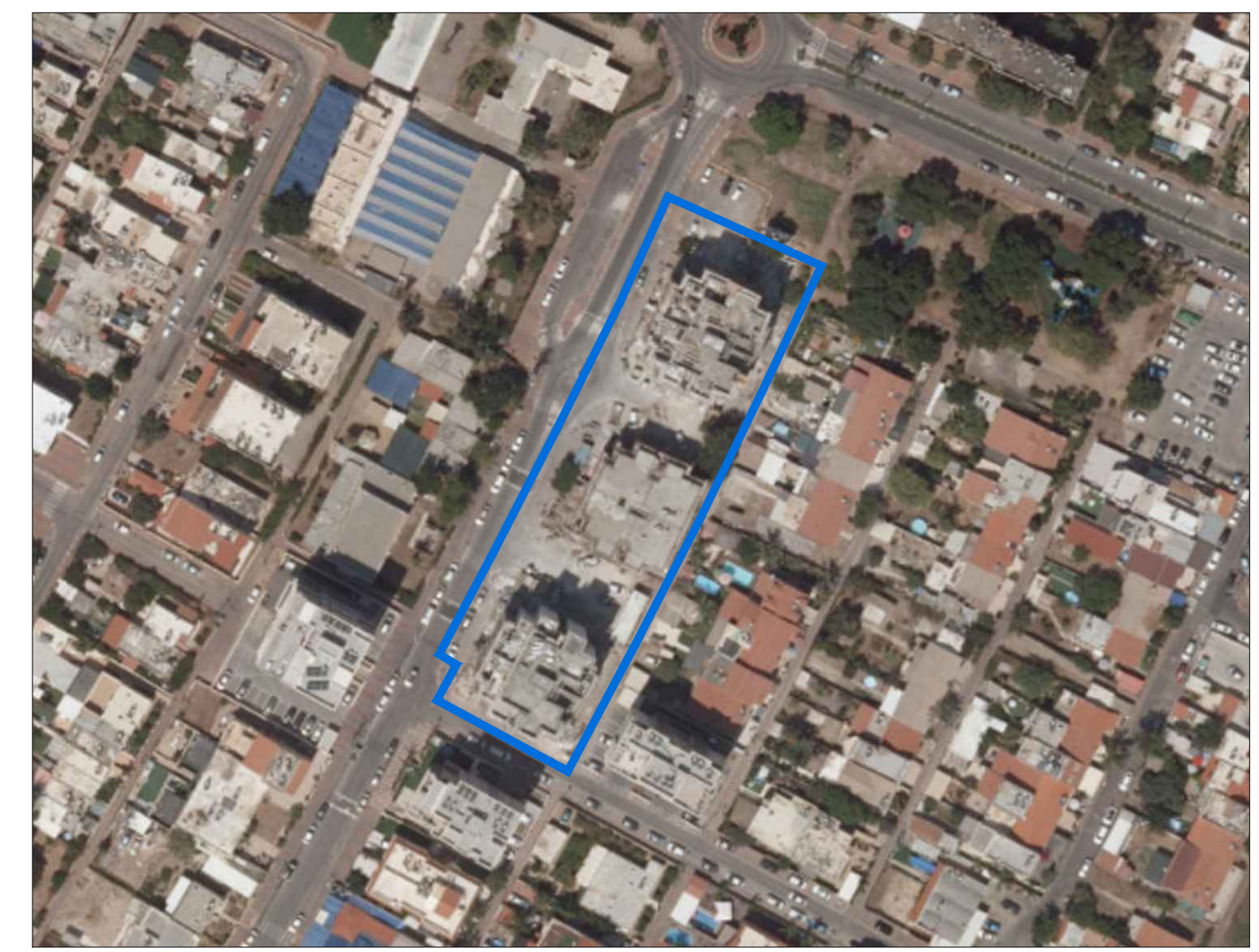
תרשים התמצאות קנ"מ 1:1250