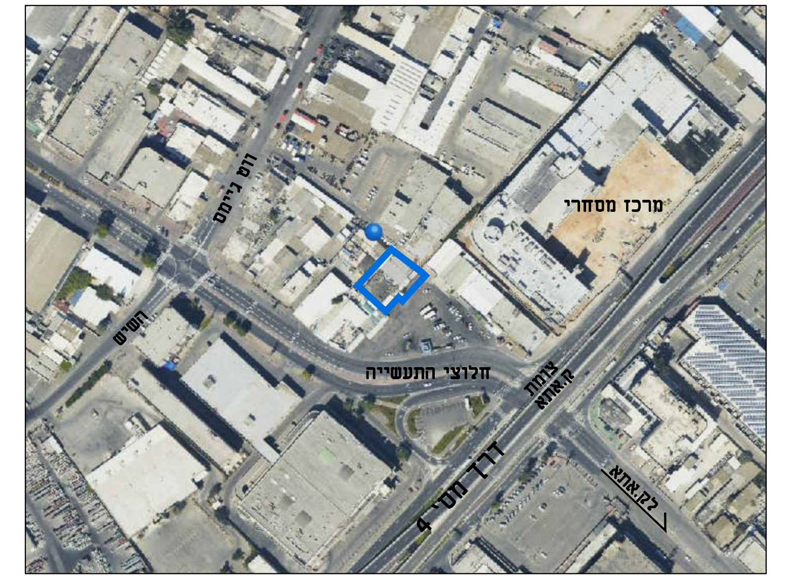
תרשים התמצאות קנ"מ 1:2500