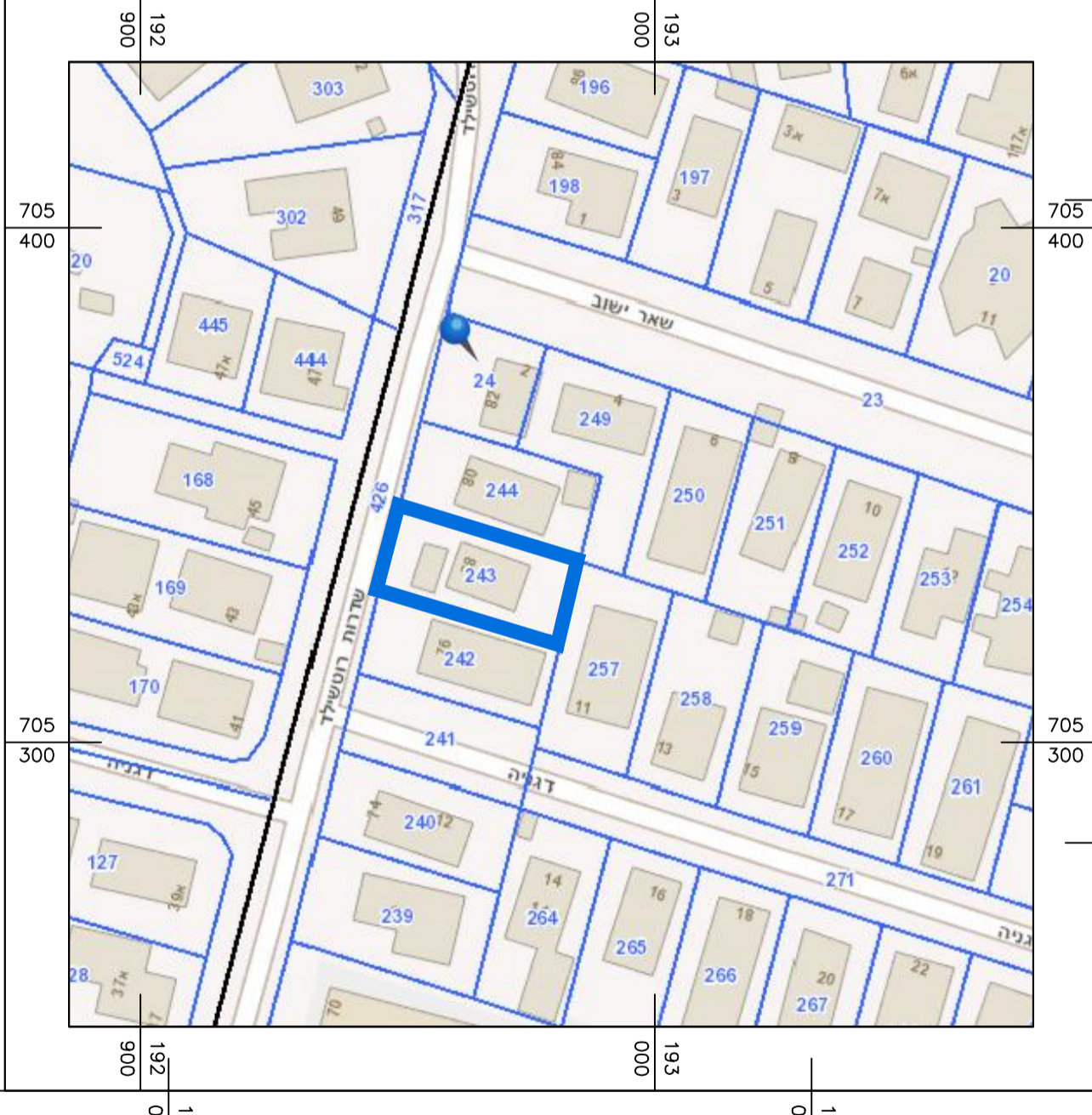
תרשים סביבה קני"מ: 1:250