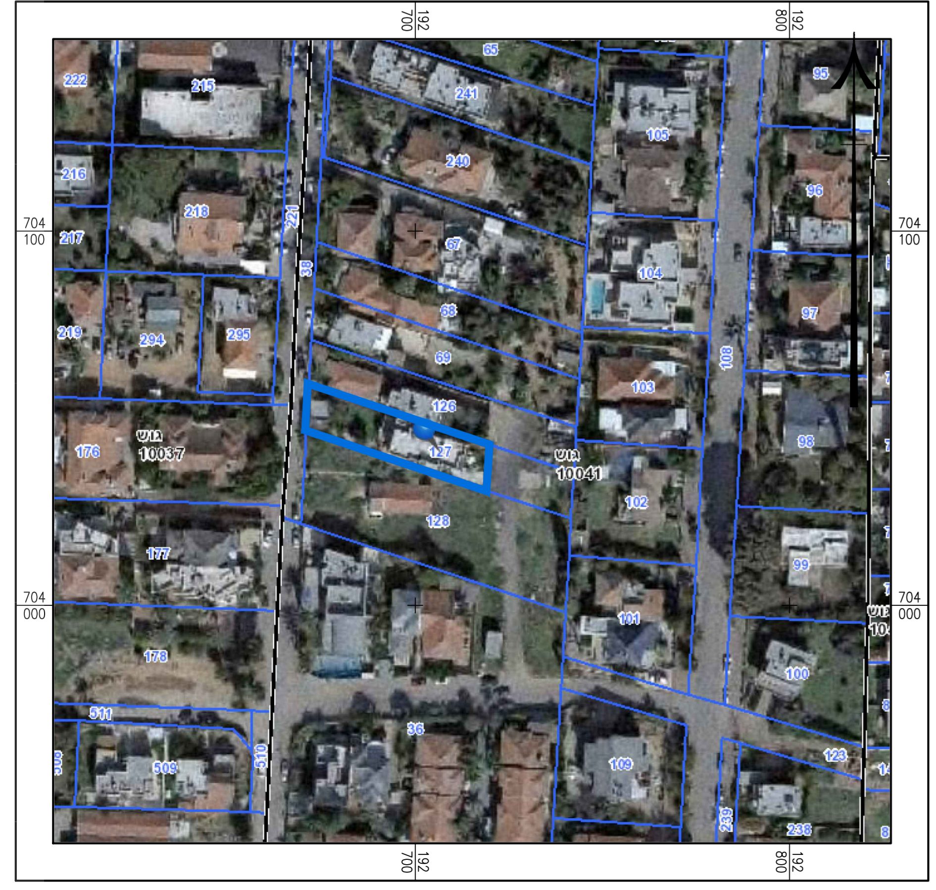
תרשים סביבה כללית - קני"מ 1:2500