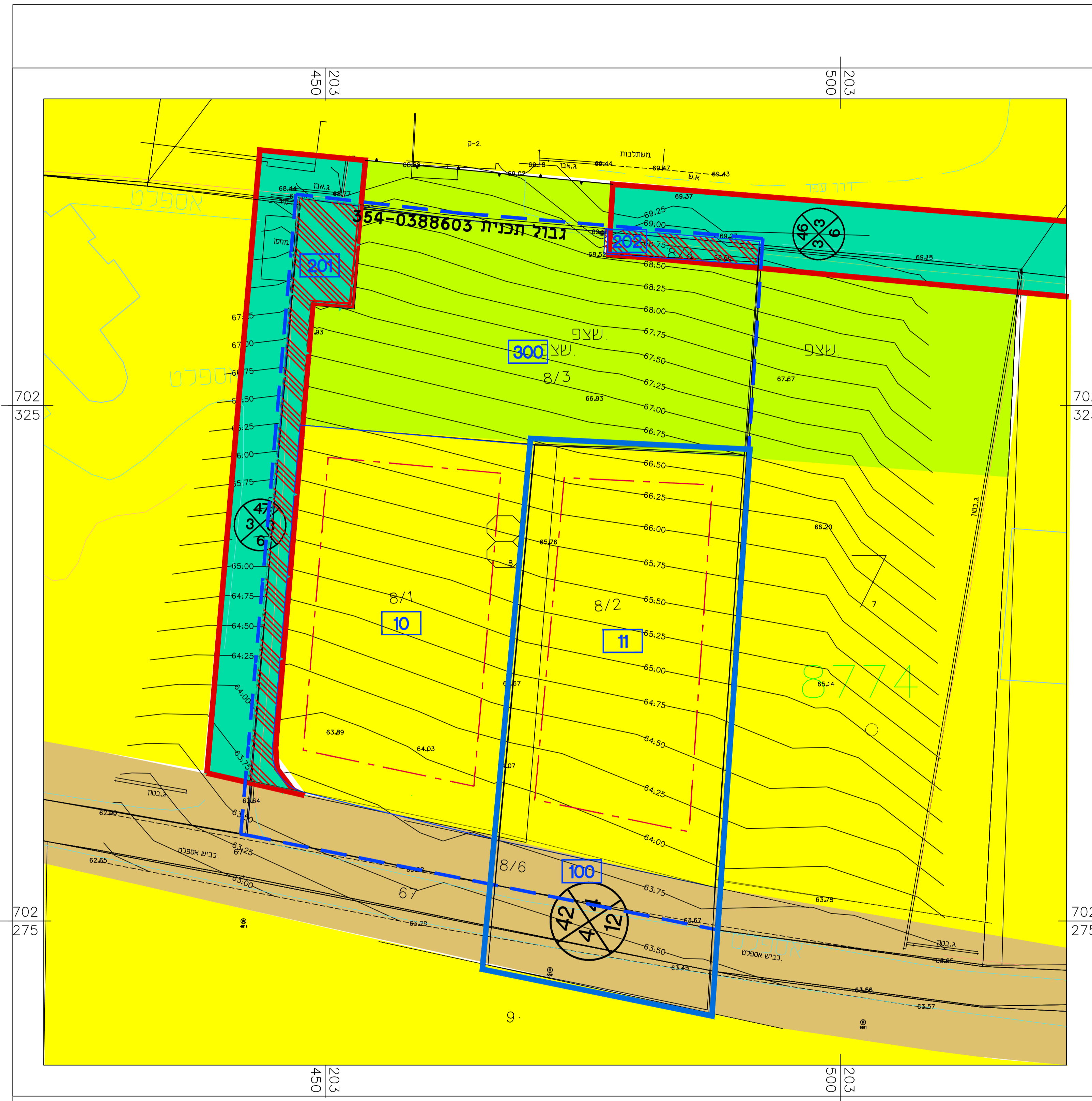
מצב מאושר קנ"מ 1 : 500 (ע"פ תכנית ע"א 360)