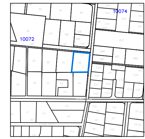
תרשים סביבה קנ"מ: 1:2500