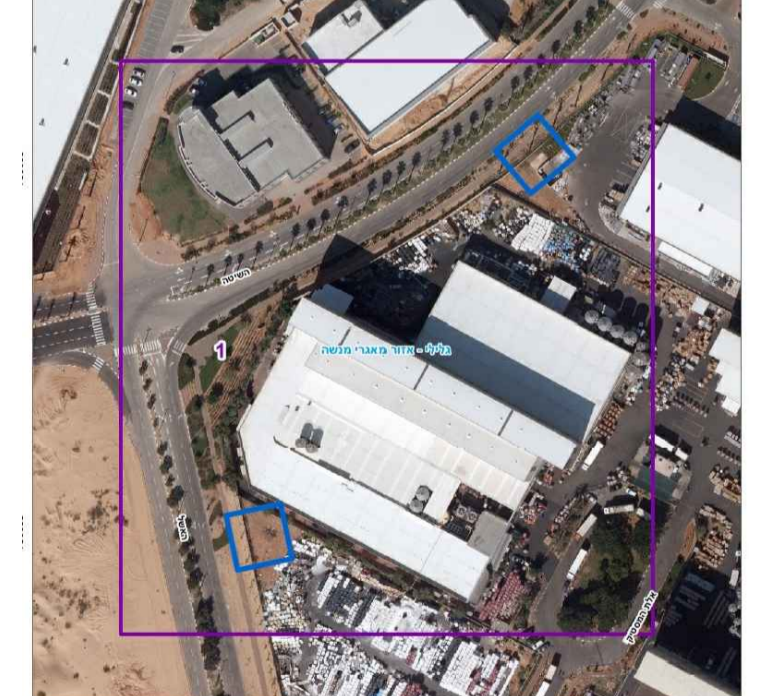
התכניות שחלות בשטח:

- 399-0395822 רשת חלוקת גז טבעי בלחץ נמוך לאורך רחוב האשל שבאזור התעשייה קיסריה. ג/322-ב - אזור התעשייה קיסריה שלב א+ב