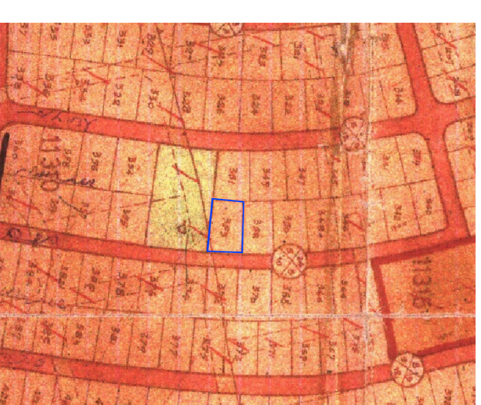
יעוד קרקע שלא עפ"י תנאי"ת 2016