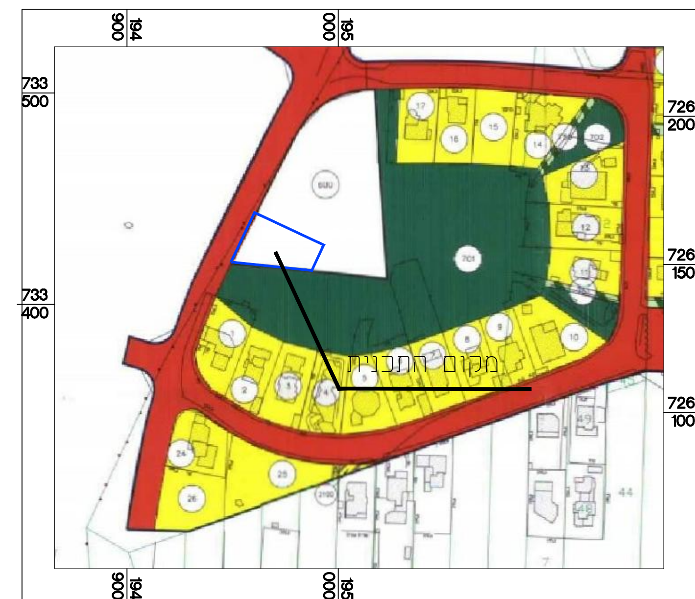
מתוך 2\12\12 קנ"מ 1:1250