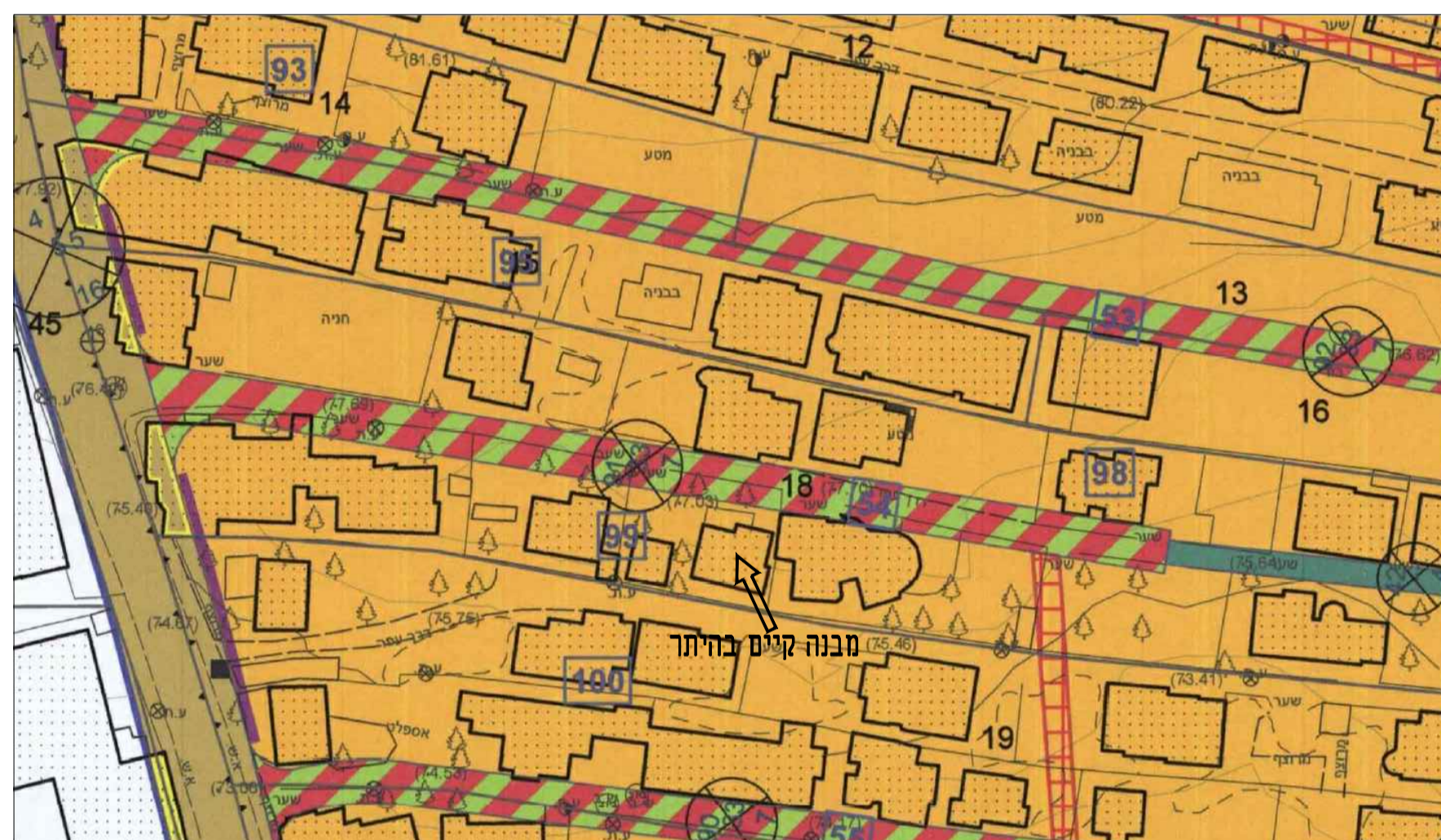
מצב מאושר עפ"י תכנית : 354-0080036 אל-שבטיה קנ"מ 1:1000