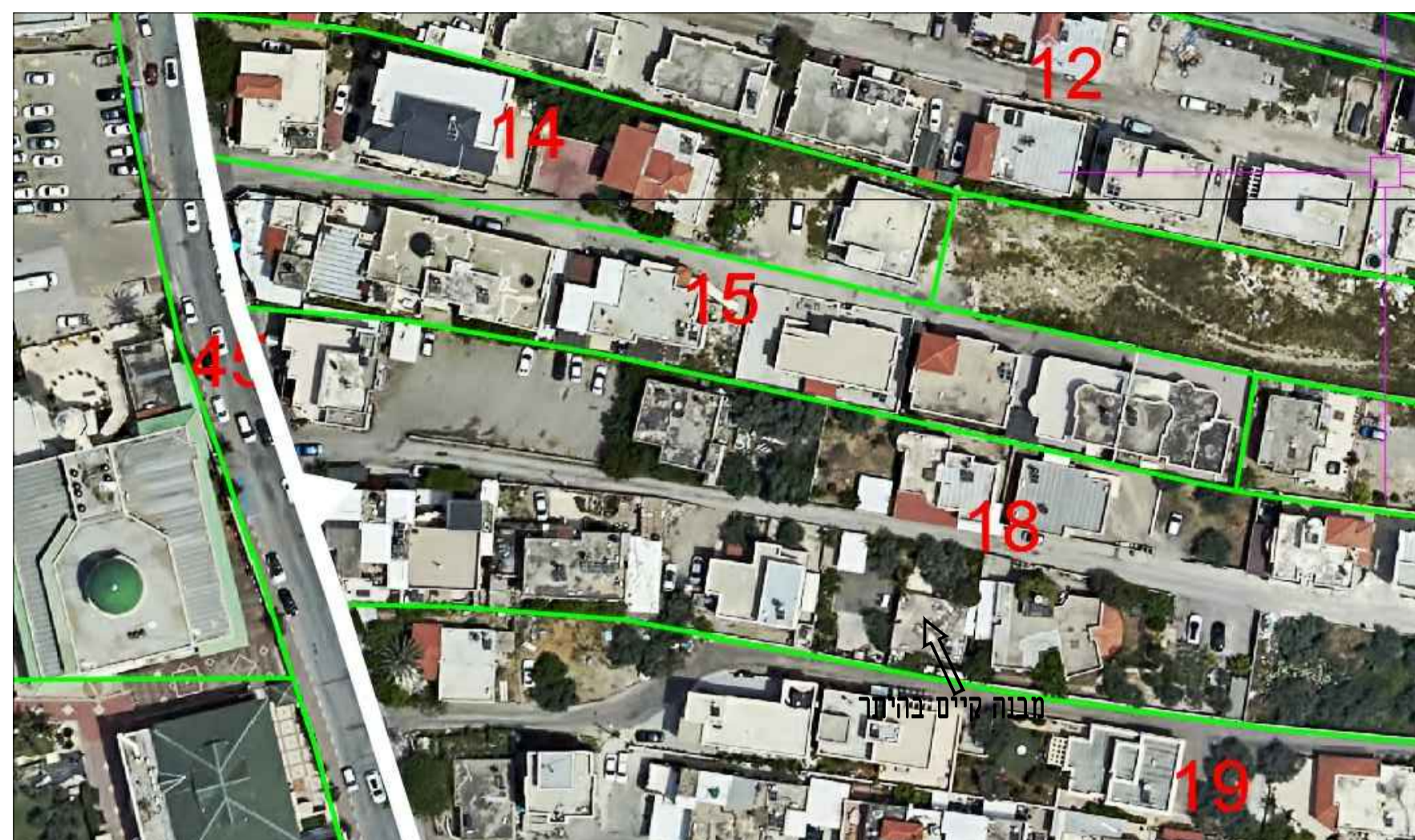
תצ"א 06.05.2021 קנ"מ 1:1000