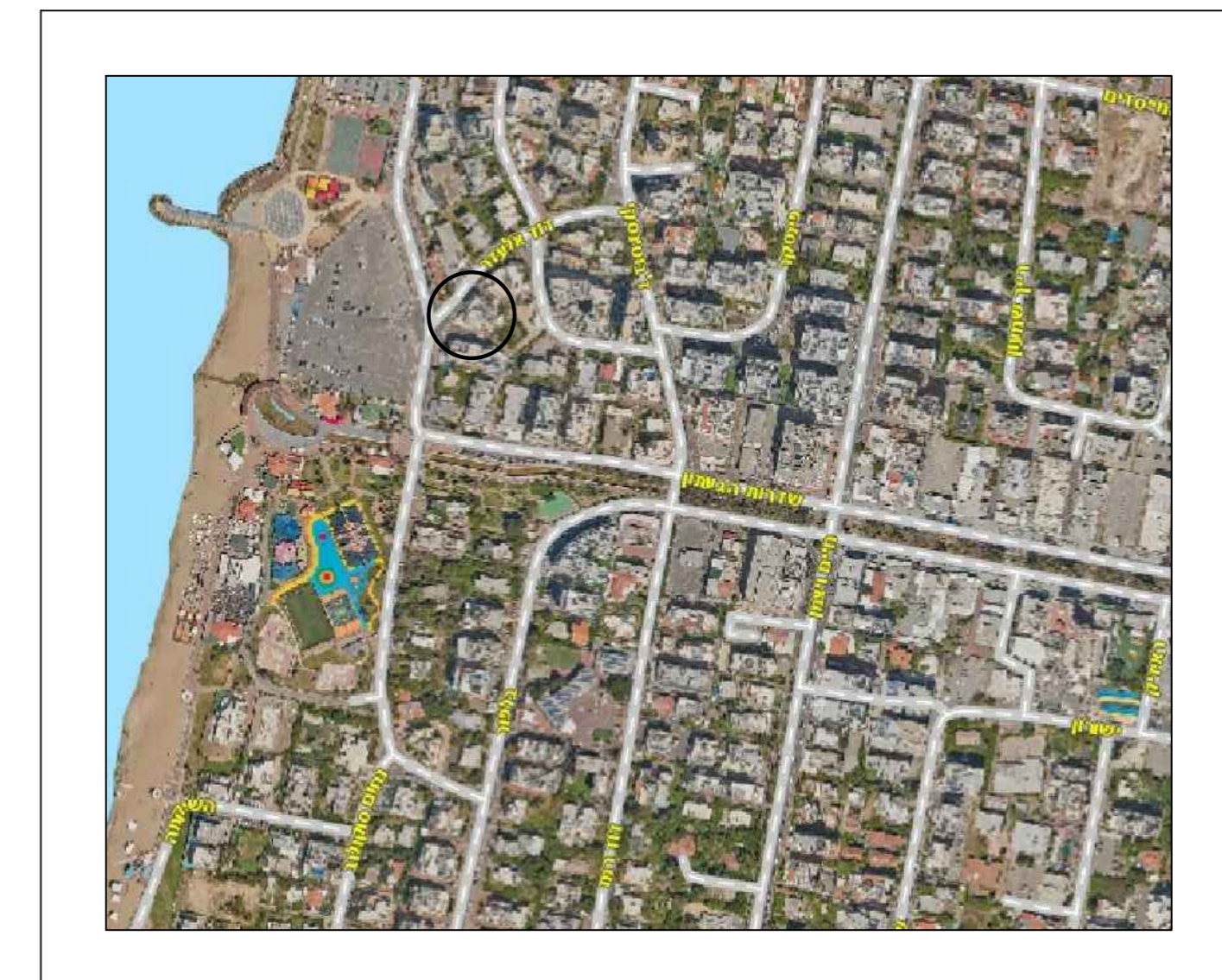
תצ"א ללא קנ"מ