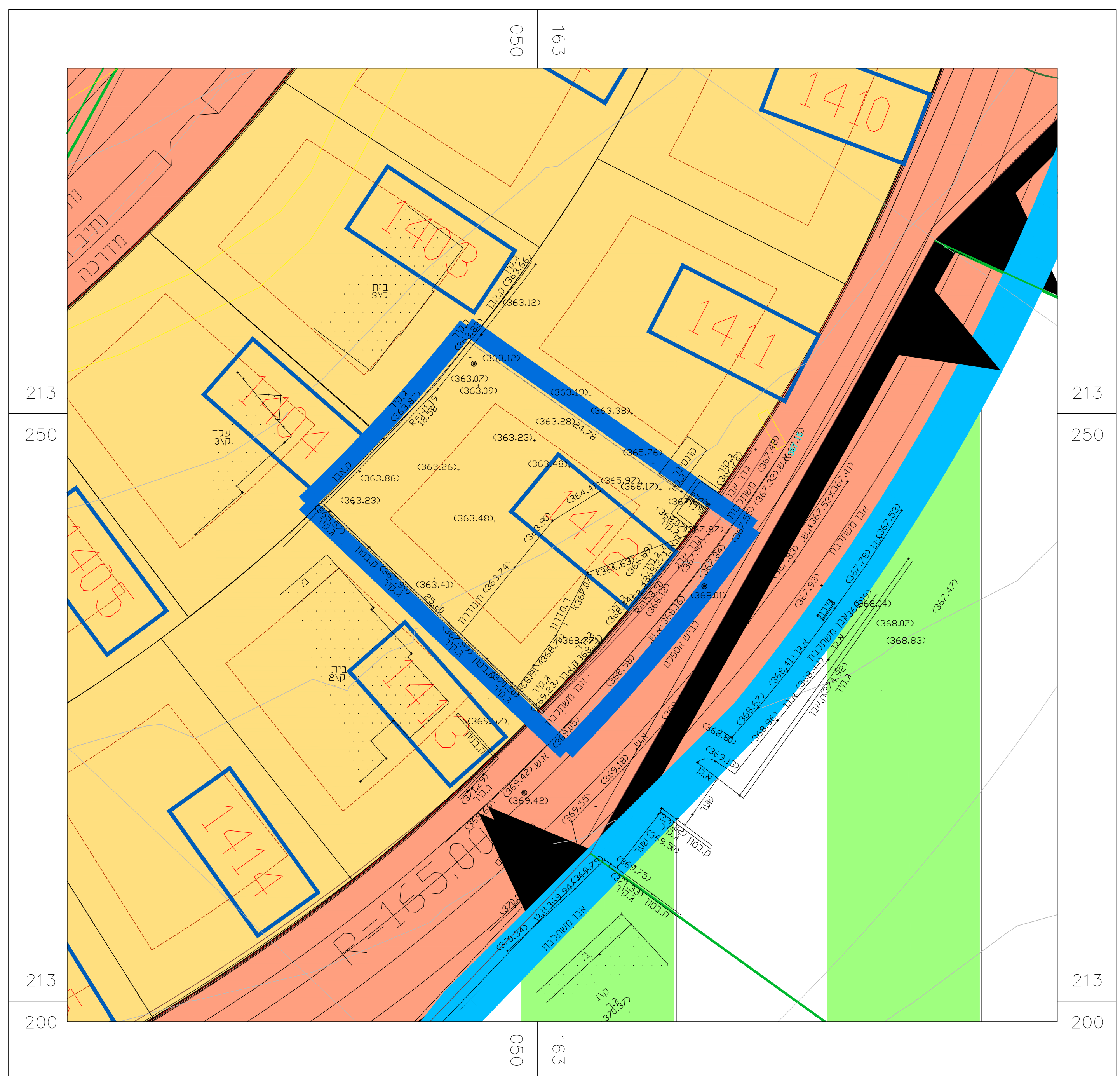
תשריט מצב מאושר קנ"מ 1:250