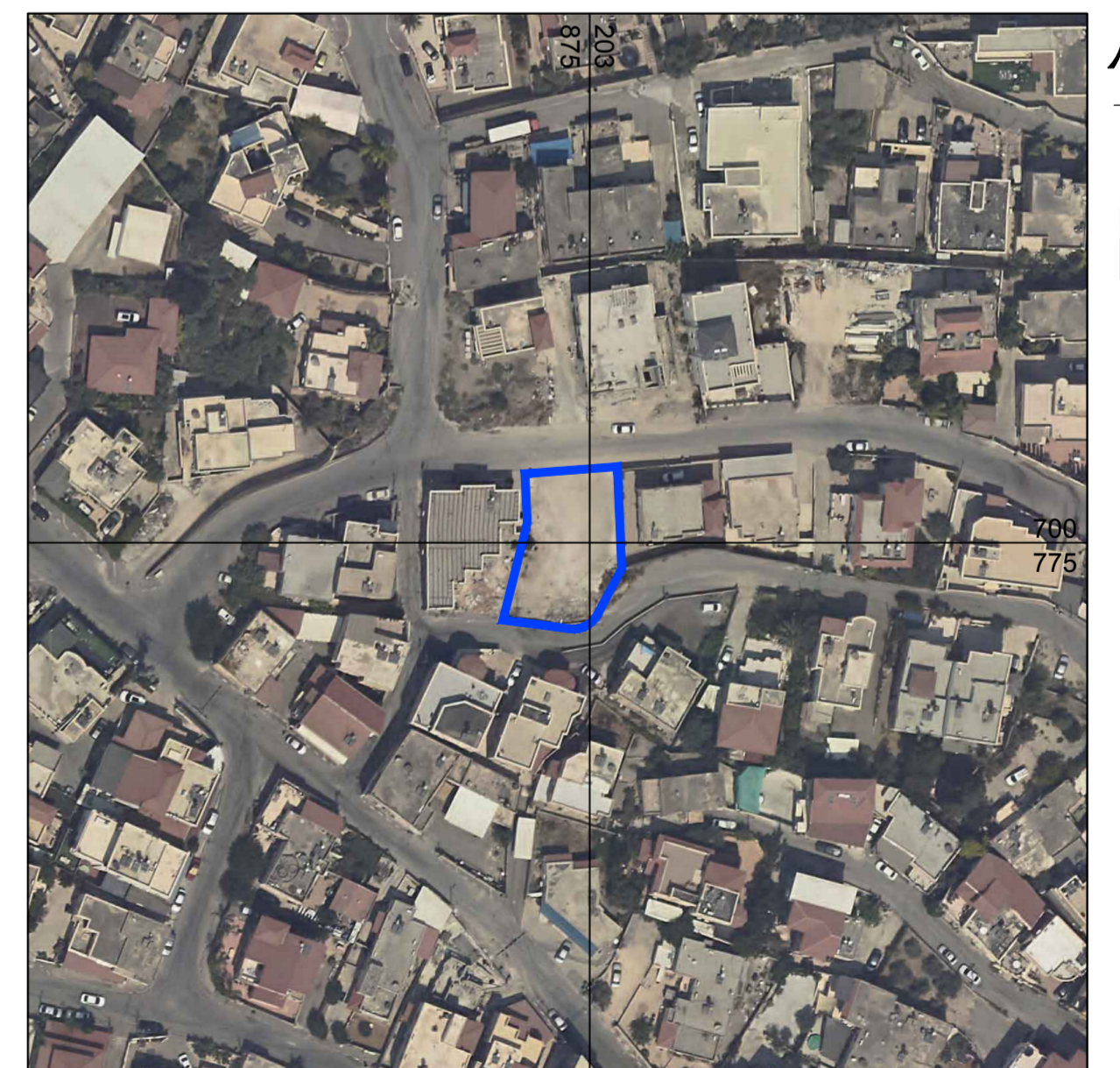
תרשים התמצאות קנ"מ 1 : 1,250