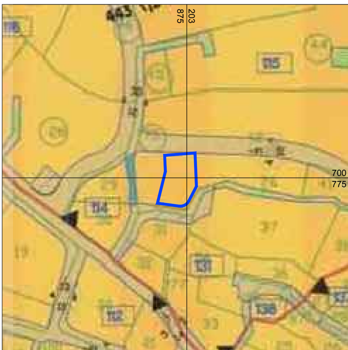
ענ\1052 קנ"מ 1 : 1,250