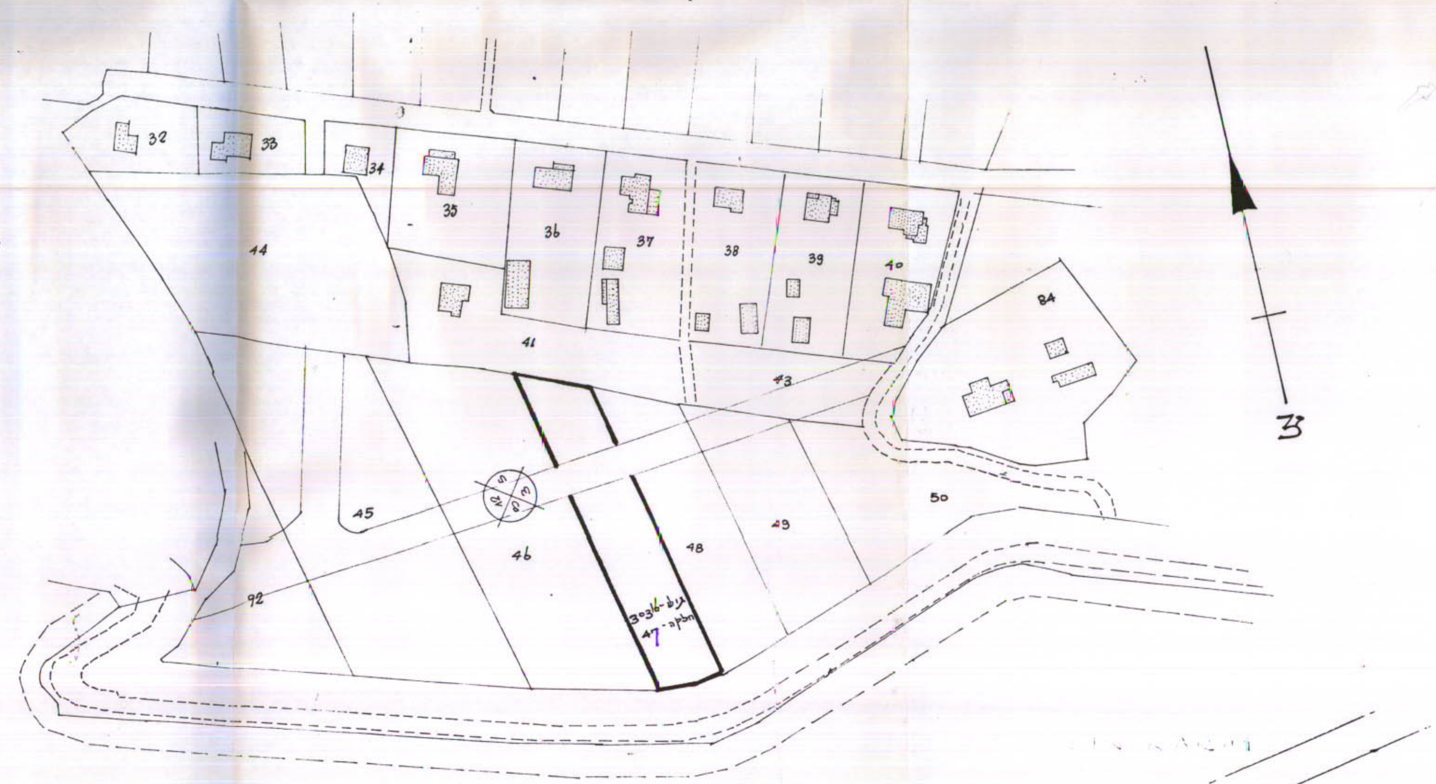
תוליים הסביבה ק.מ. 1:1250

חתימת המוכר חתימת סבצע התכנית חתימת בעל הקרקע תאריך: 22.3.52