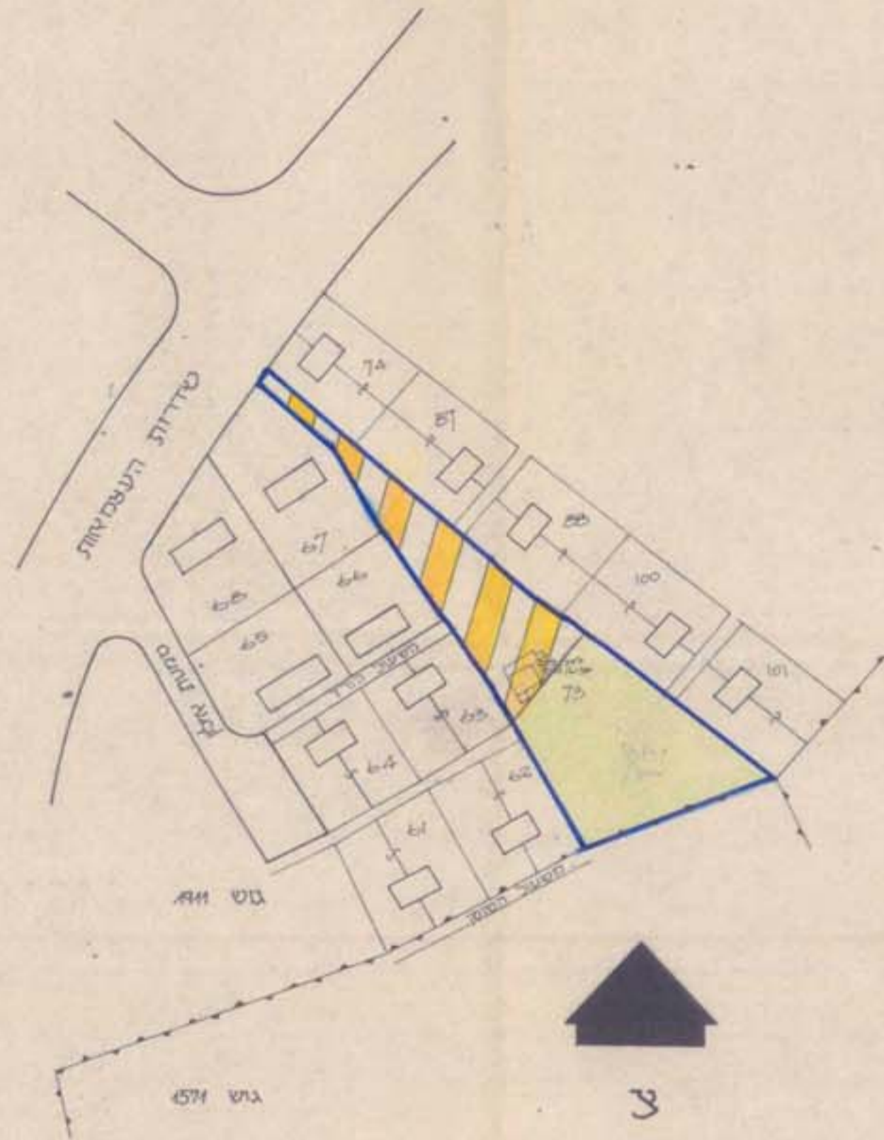
תרשים מצב קיים 1:1250