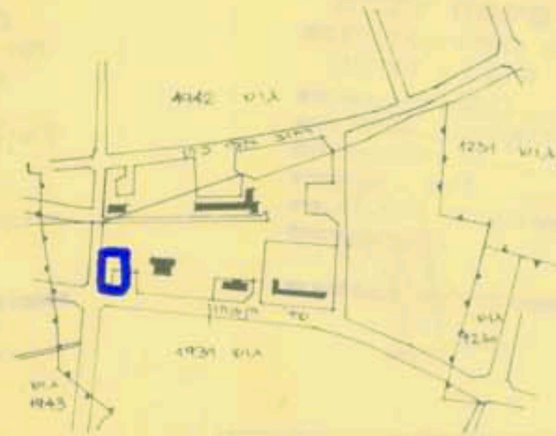
תרשים הסביבה קמ: 1:10,000