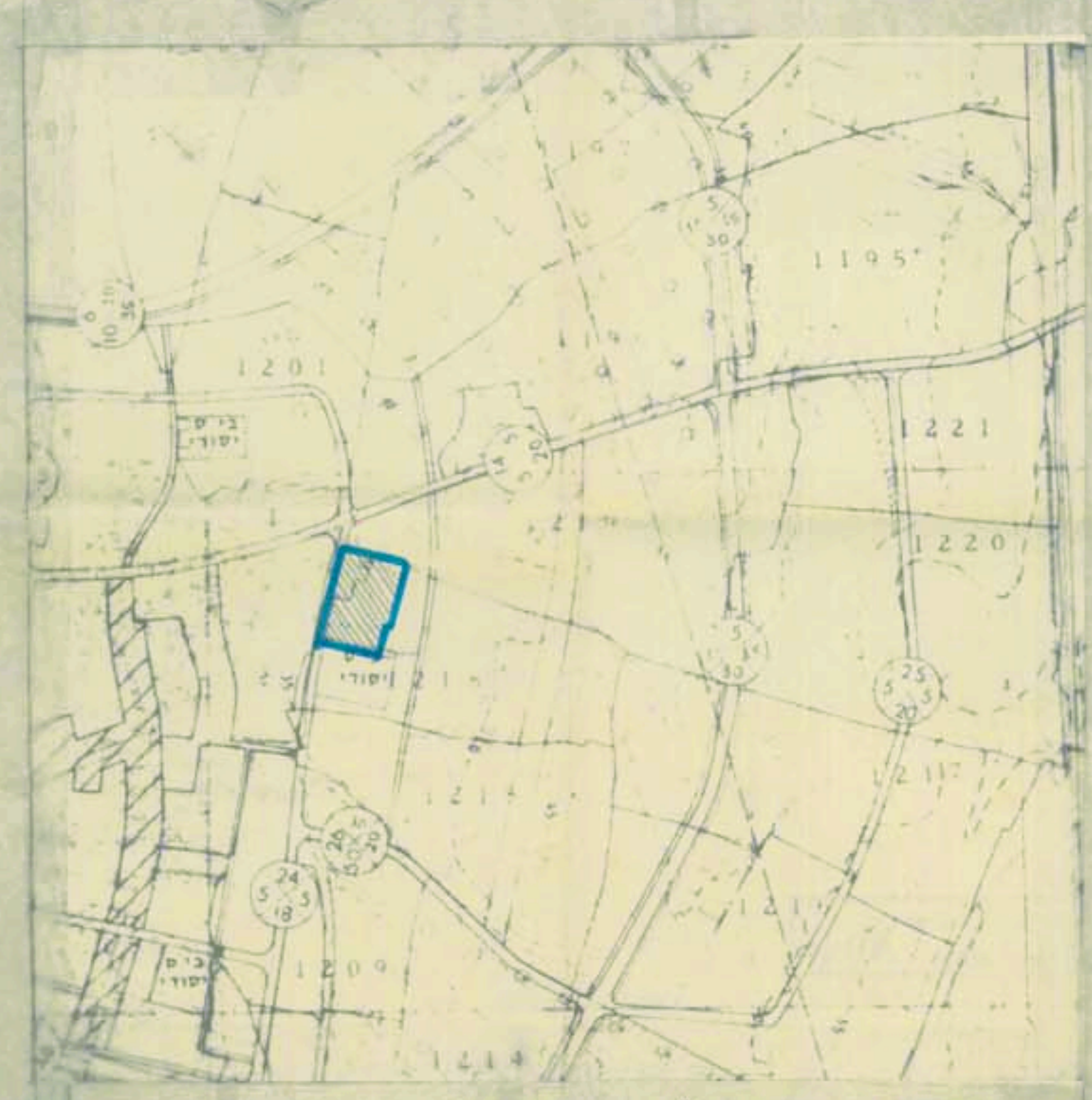
תכנית הסביבה קנ"מ 1:10.000

משרד הפנים חוק התכנון והבניה חסי"ה 1965 מ.חוז הדרום מ.ת. 11/88 15/12/88 13.12.88 משרד הפנים חוק התכנון והבניה חסי"ה 1965 מ.חוז הדרום מ.ת. 11/88 15/12/88 13.12.88