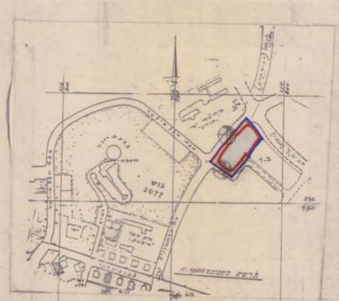
תרשים הסביבה ק.ב. 1:5000 - מצב קיים