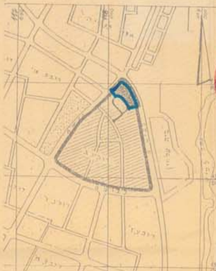
תרשים הסביבה ק.ת. 1:20,000