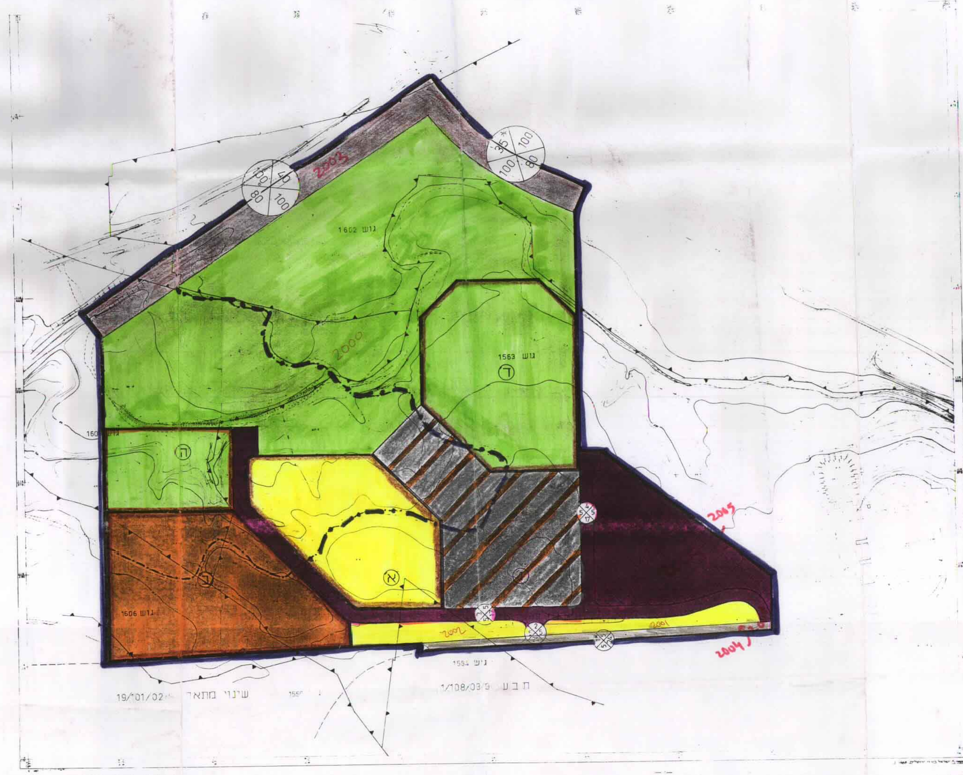
מצב מוצע קנ"מ 1:2500