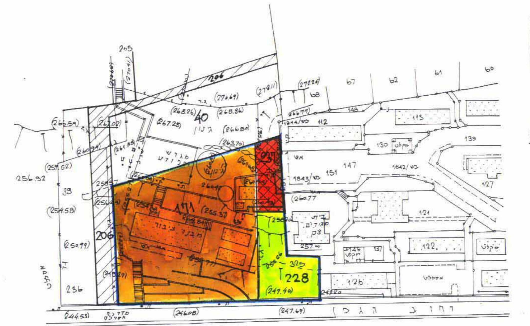
מצב קיים קמ: 1:1250