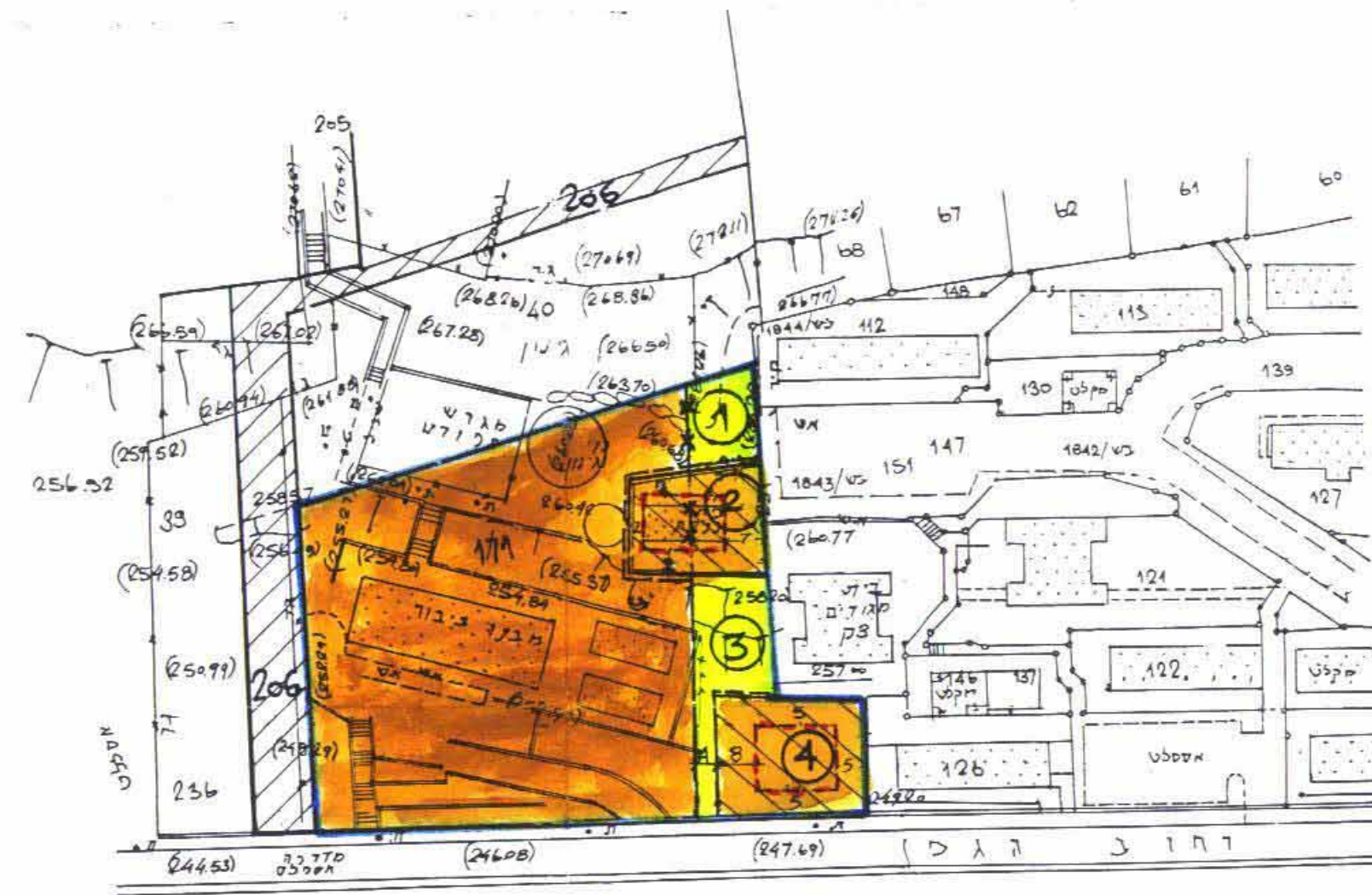
מצב חדש קמ: 1:1250