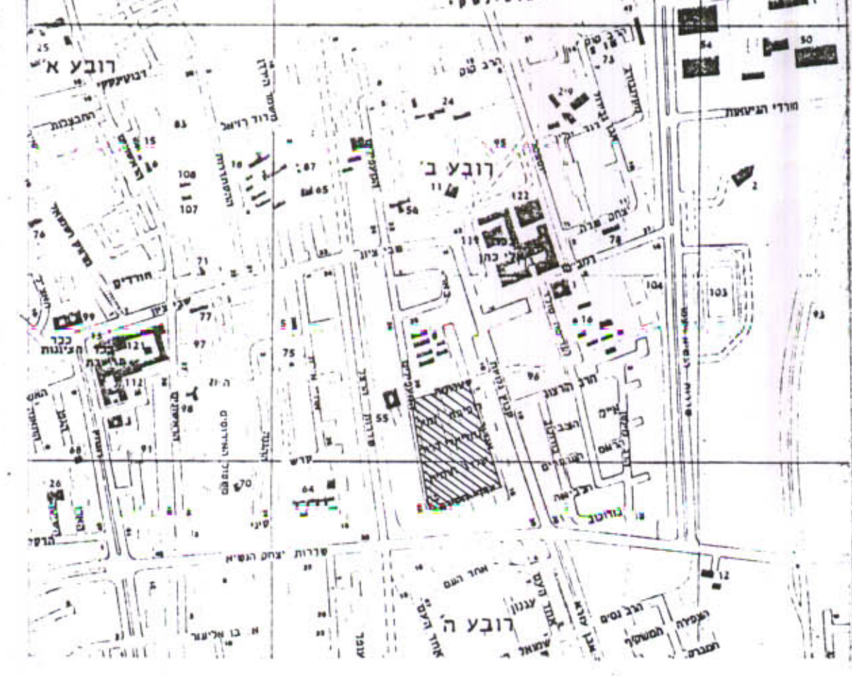
תרשים סביבה קנ"מ 1:10000

משרד הפנים מחוז הדרום חוק התכנון והבניה תשכ"ח-1965 אישור תכנית מס. התכנית מוגשת מכח סעיף 108(ג) לחוק י"ד תעודת המחוזית