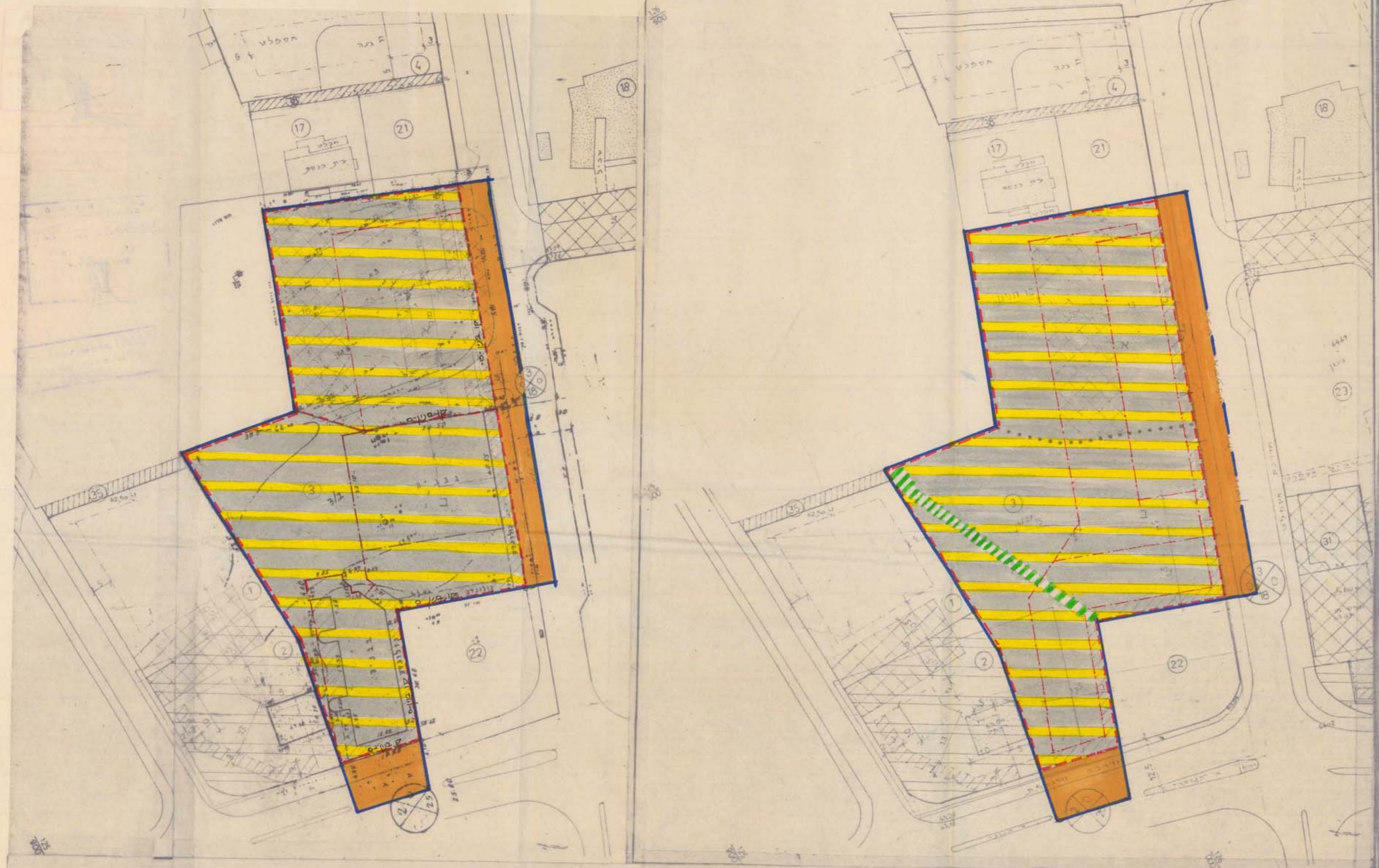
תכנית מוצעת ק.ג. 1:500