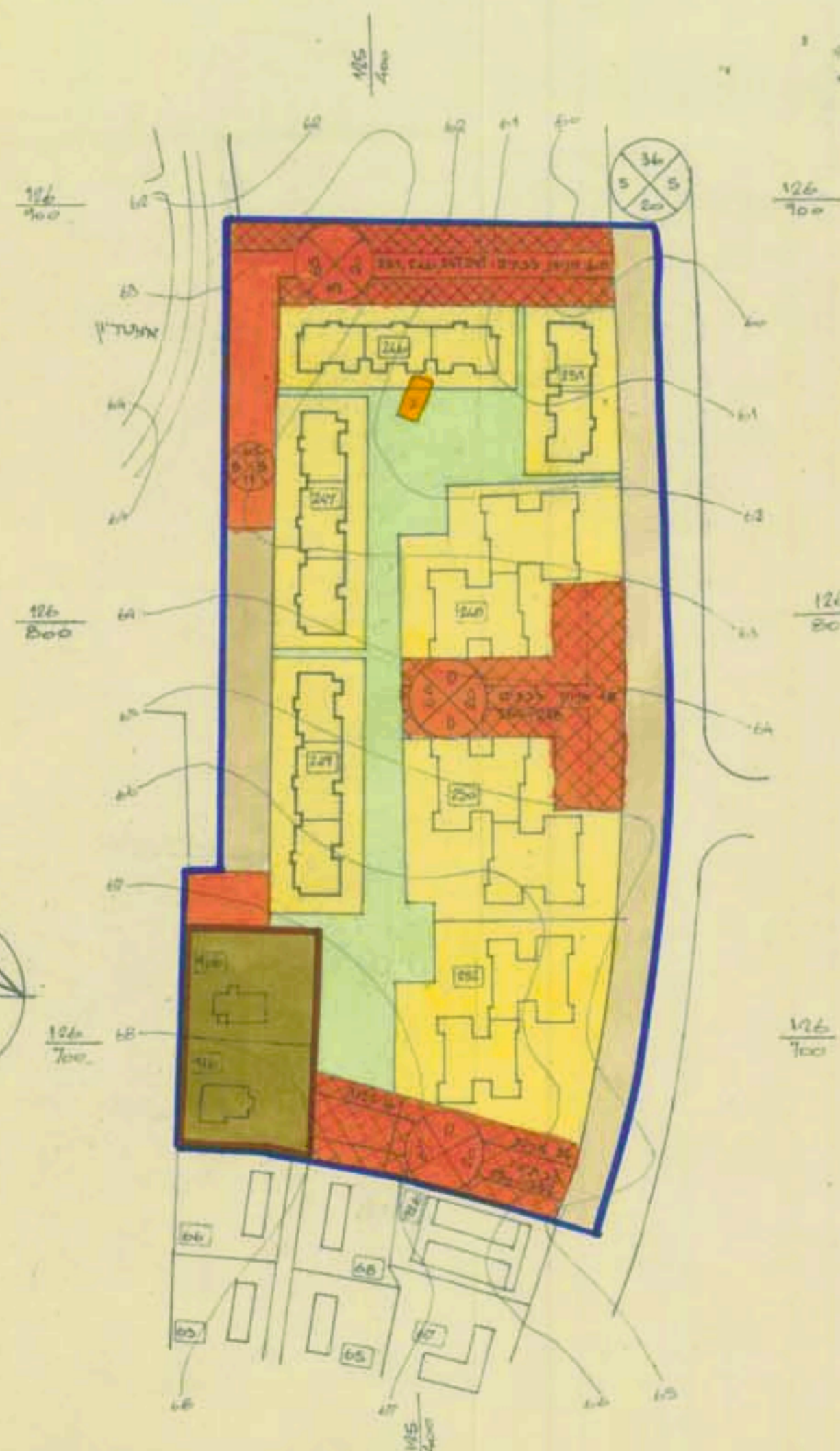
תכנית בע. מפורטת מוצעת ק.מ. 1:1250 תכנית זו מבוססת על מפת מדידה של אגף המדידות שסטפרה/58/1 מתאריך 10.1979

חתימות בעל הקרקע מחבר התכנית מגיש התכנית משרד הבינוי והשכון נחז' ירושלים 27-07-1980