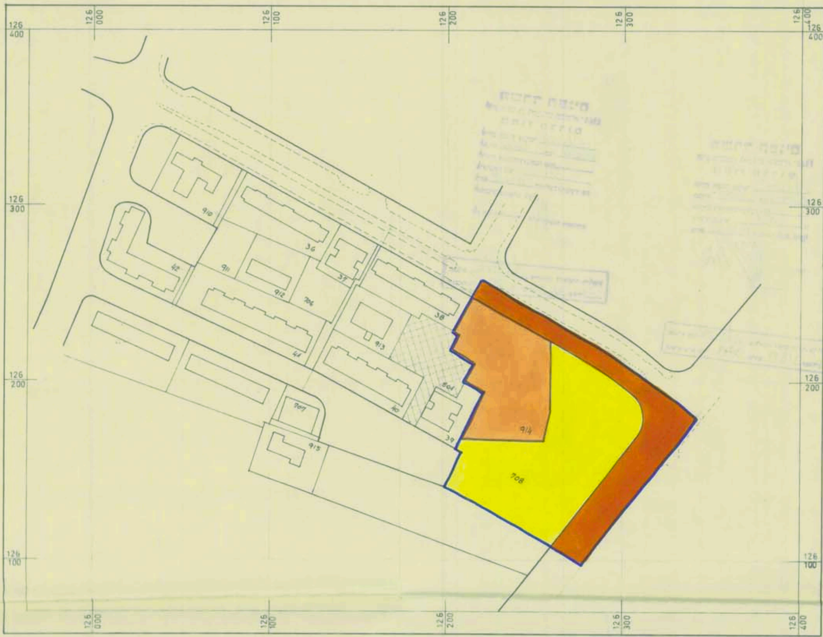
תכנית על כי חוק רישום שיכונים ציבוריים (5/35/7) 2/103/03/8 ק.מ. 1:1250