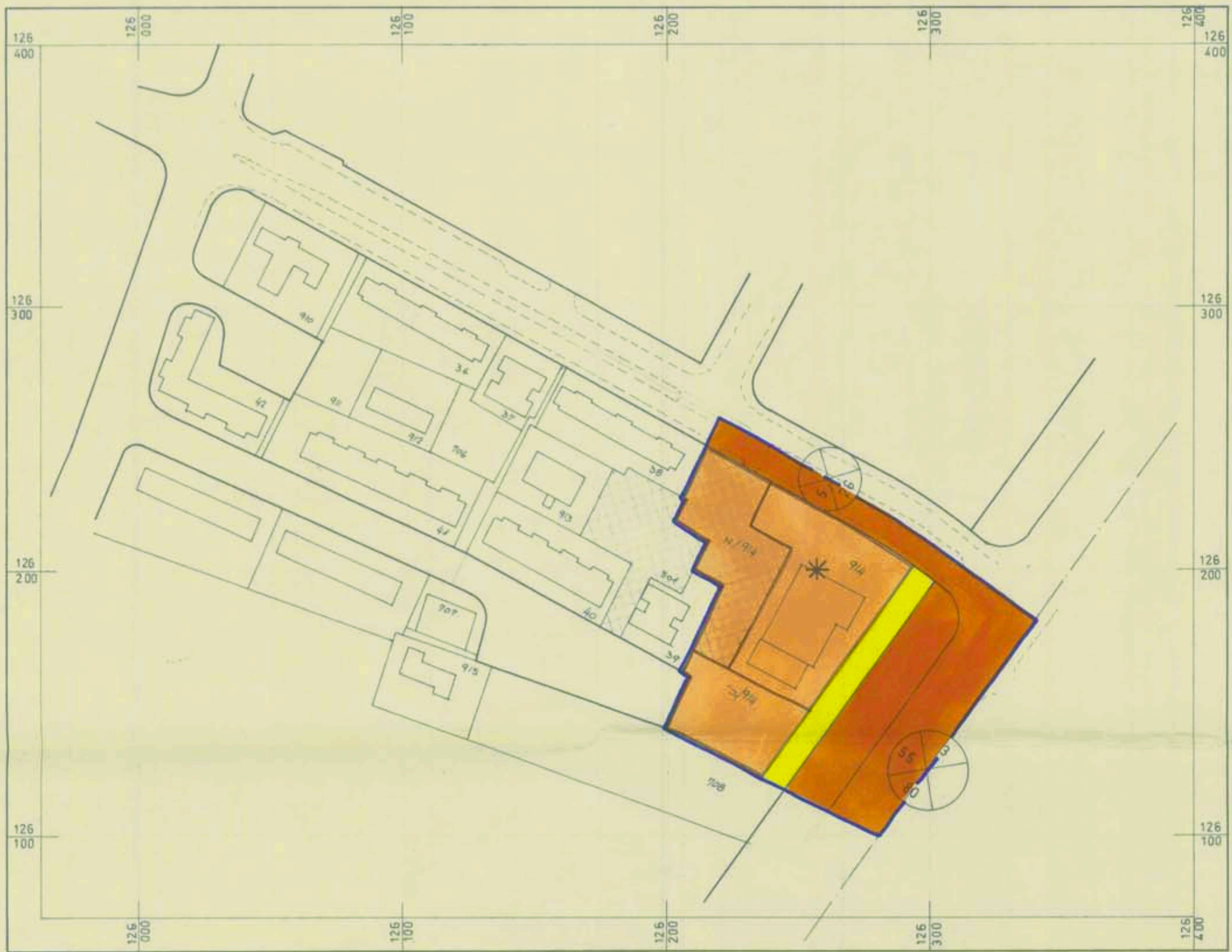
תכנית מוצעת ק.מ. 1:1250