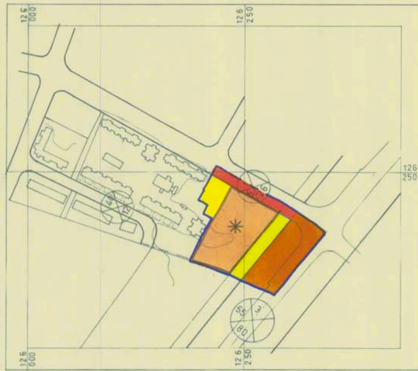
תכנית מתאר מס. 26/102/02/8 ק.מ. 1:2500