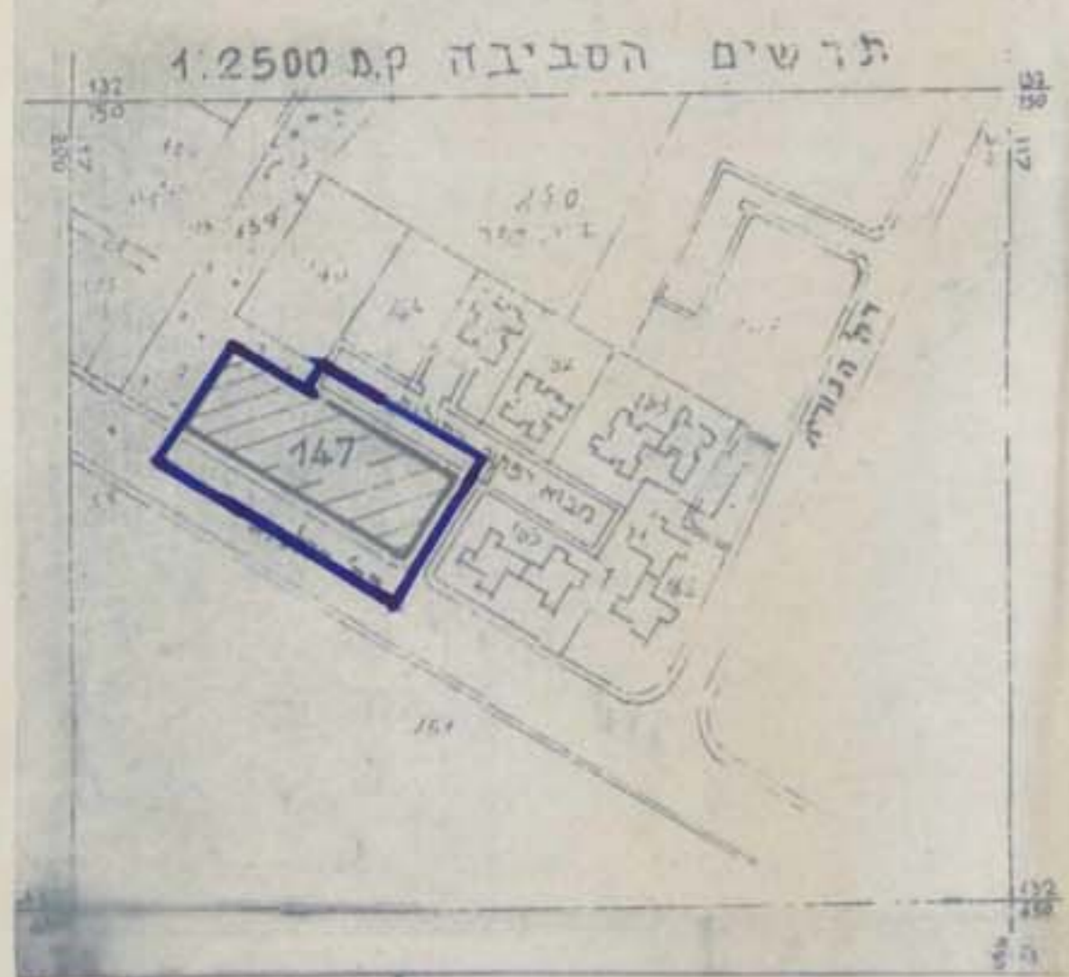
תרשים הטביבה 1:2,500