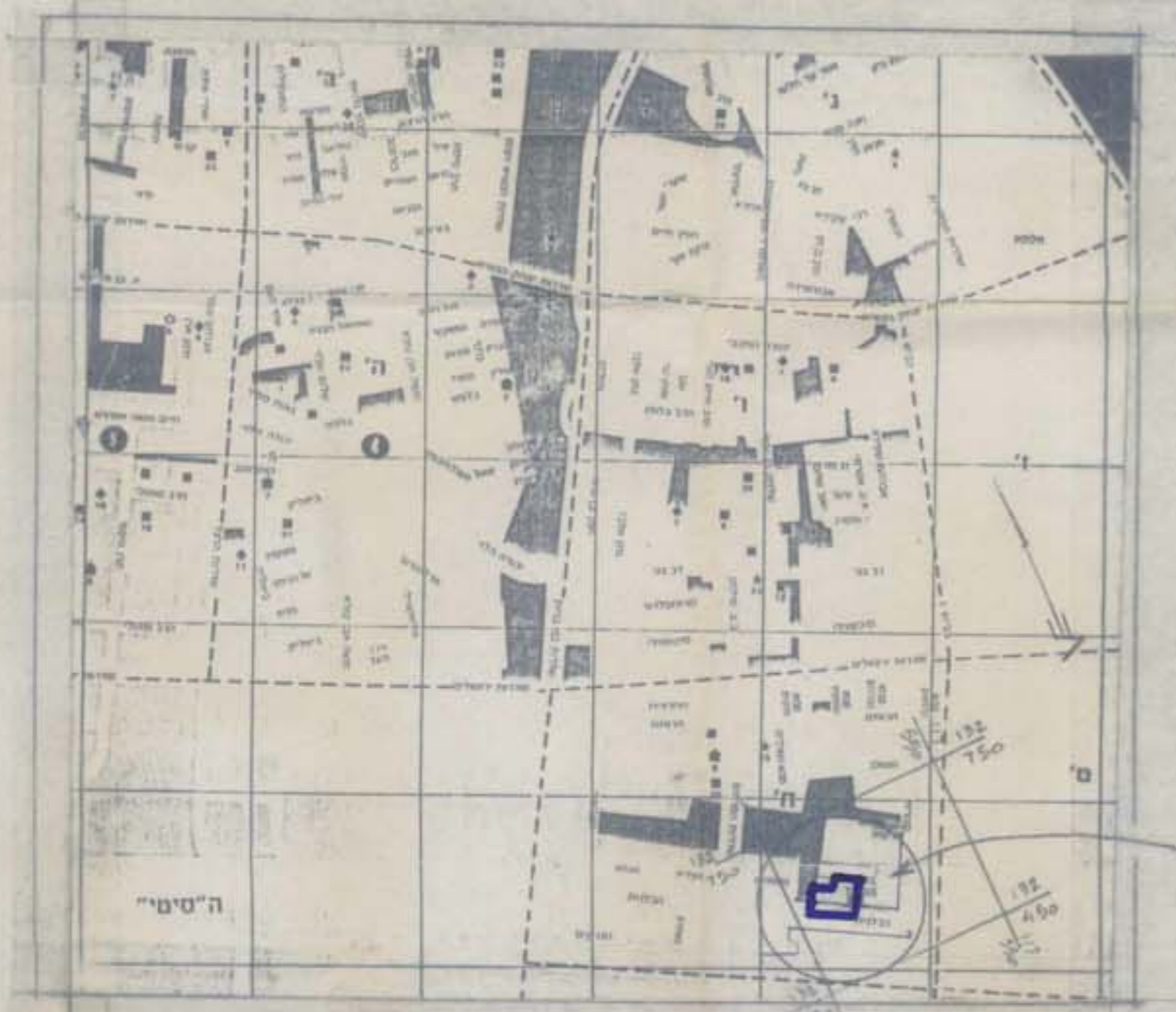
תרשים האיזור 1:10,000