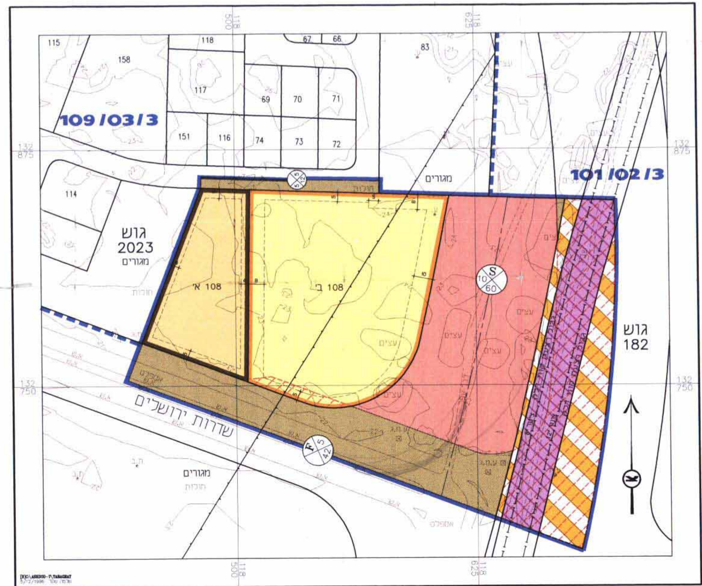
מצב מוצע קנ"מ 1 : 1250