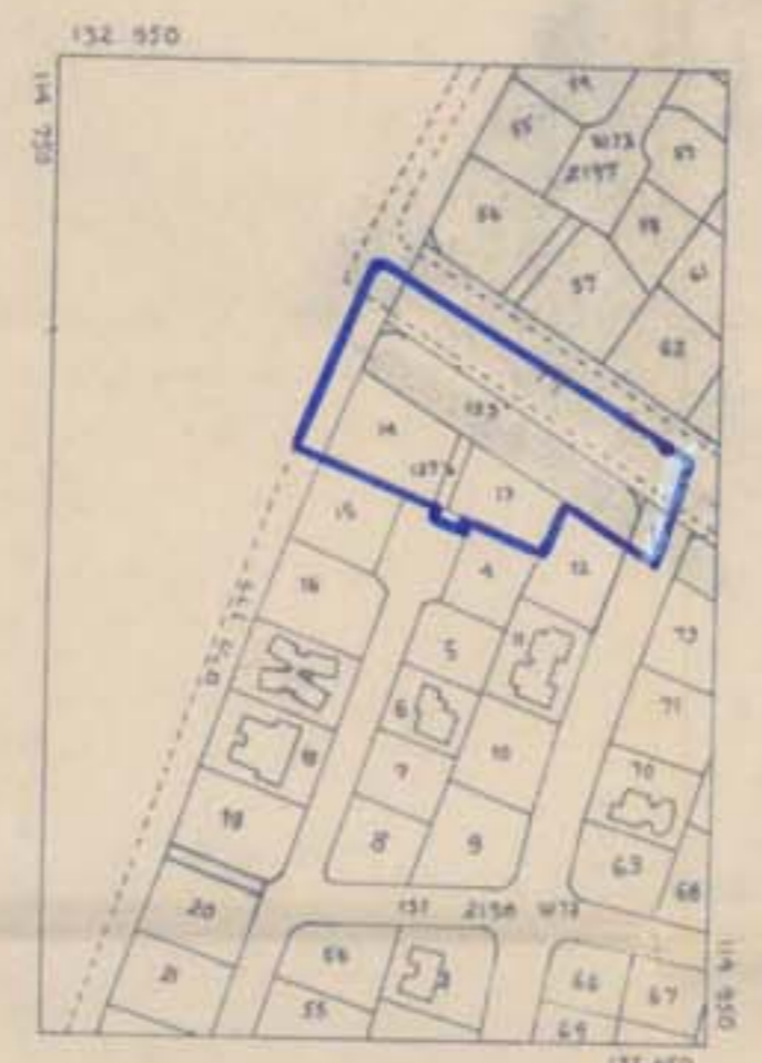
תושים סביבה 1:2500