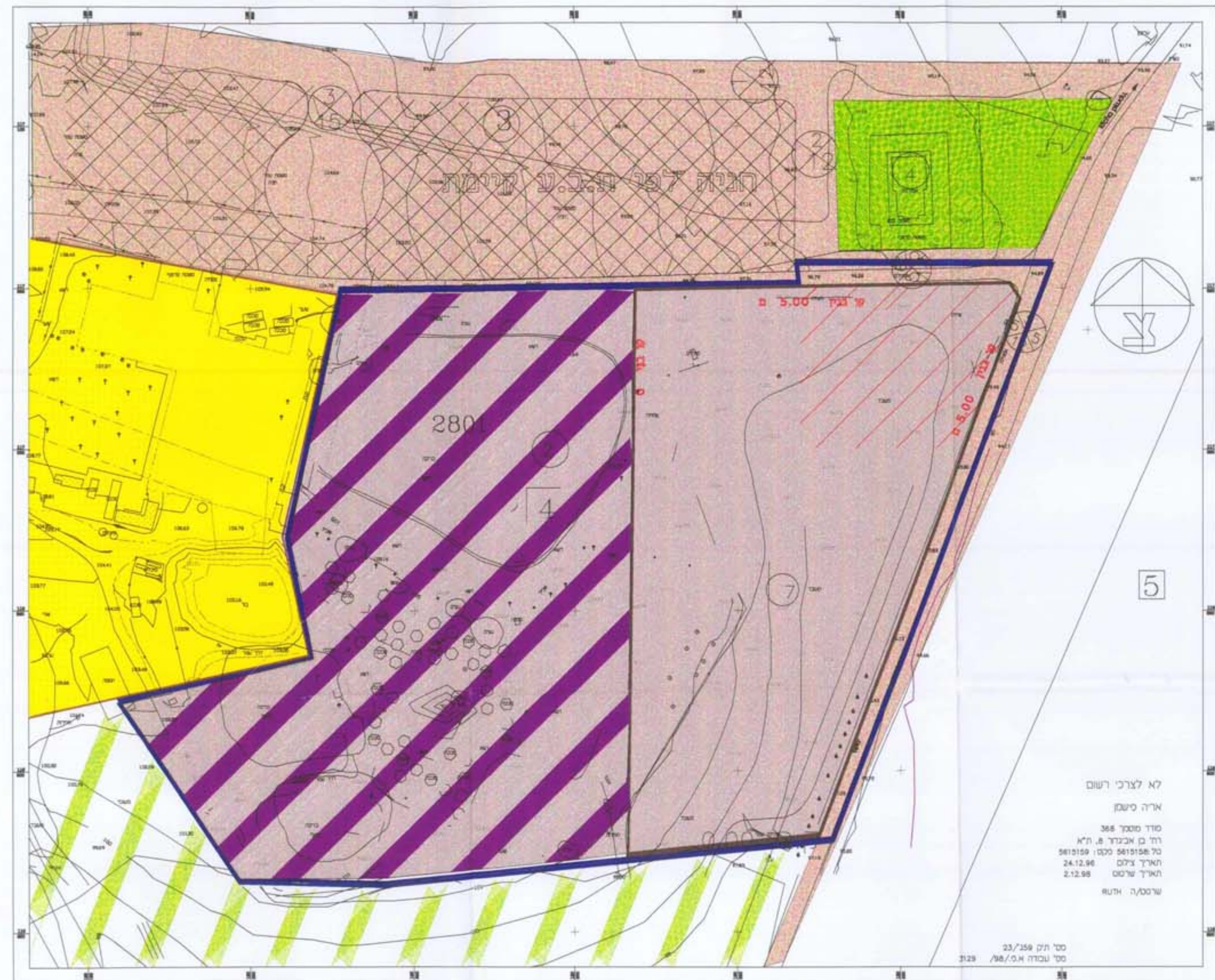
תמצב מוצע קנ"מ 1:1000