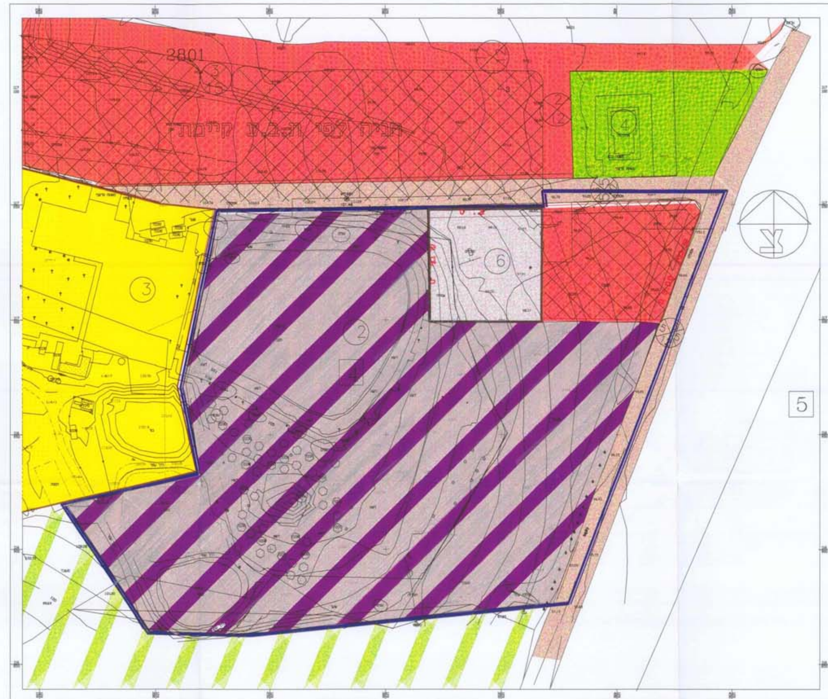
מצב קיים קנ"מ 1:1000