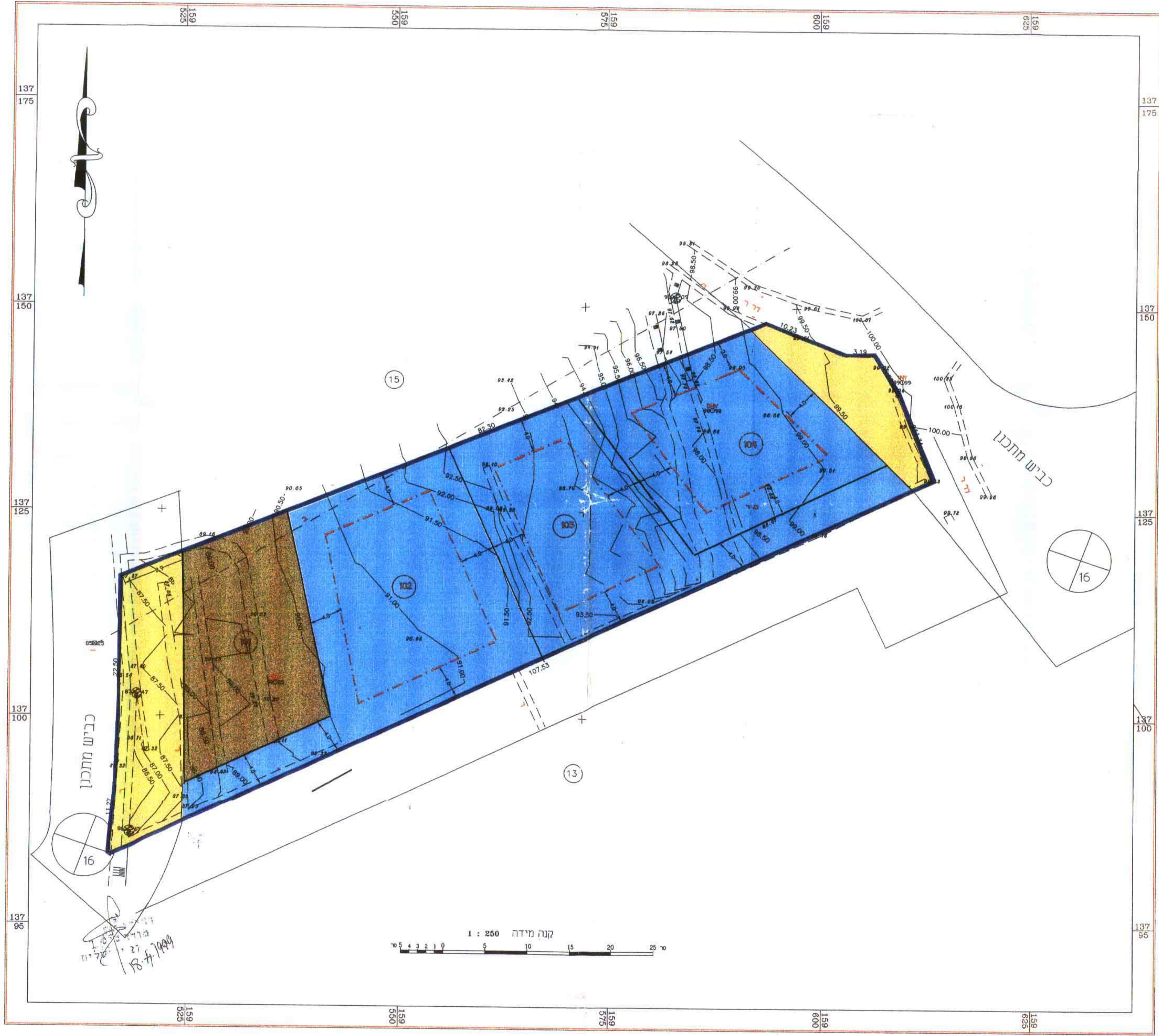
טבלת חלוקה מחדש