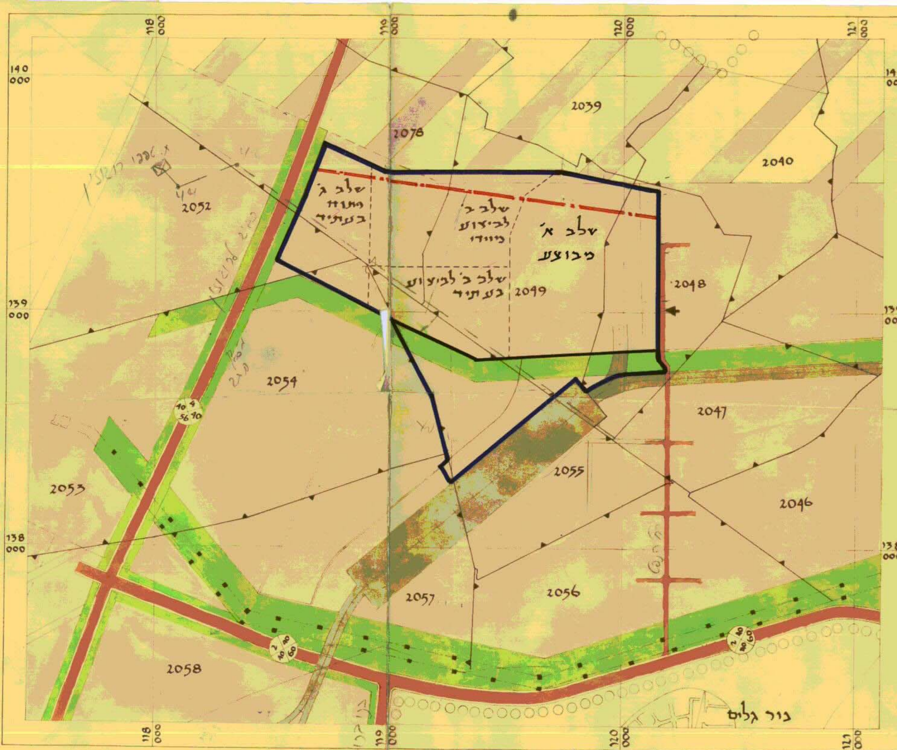
תקון לתכנית המתאר