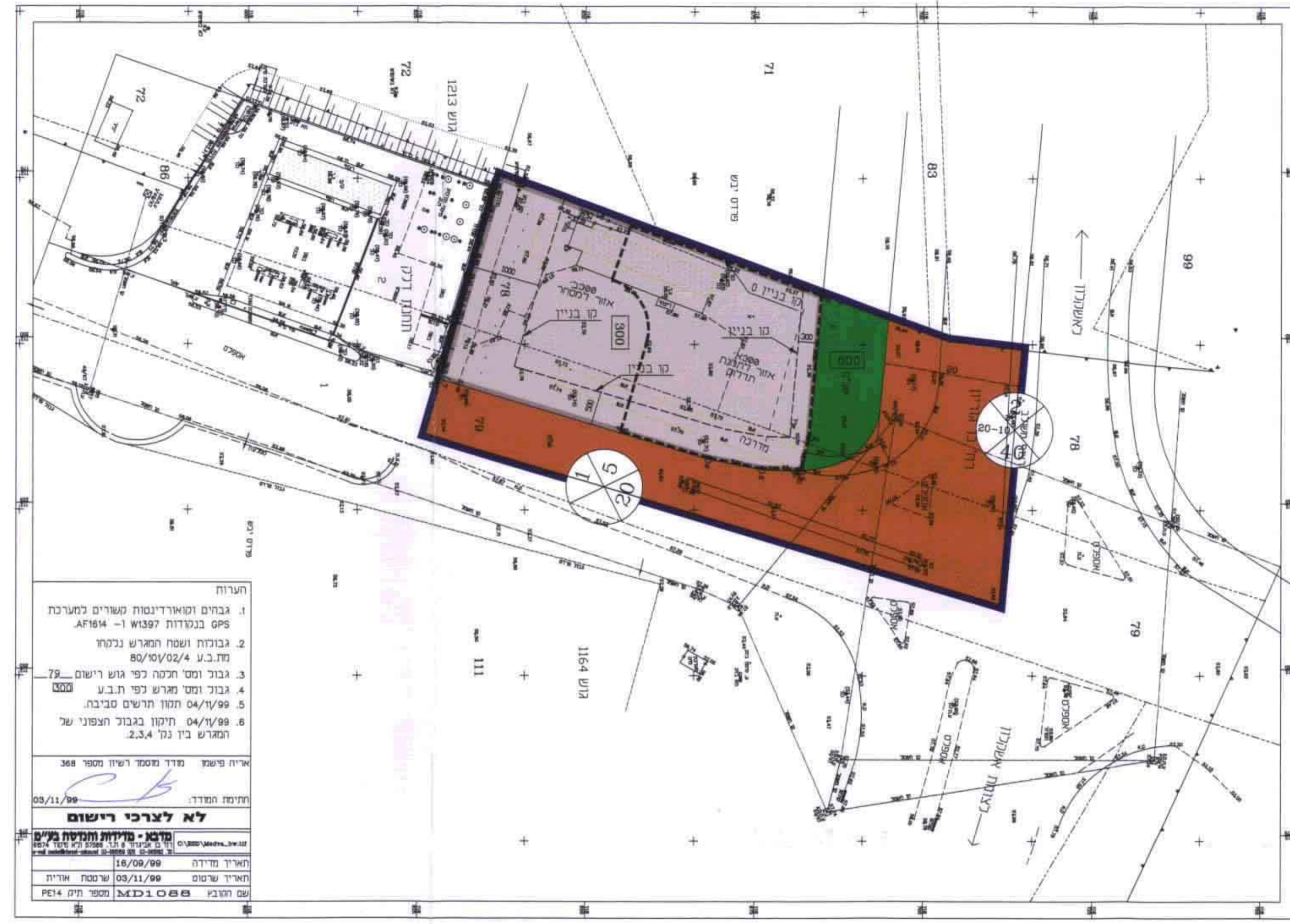
מצב מוצע ק.נ.מ. 1:500

הערות 1. גבדים ומאורדי נסות משוריים למערכת GPS בנקודות W1397 -1 AF164 2. גבולות ושטח המגרש נבדחו מת.ב.ע. 80/101/02/4 3. גבול ומס' חקקה לפי גוש רישום 79 4. גבול ומס' מגרש לפי ת.ב.ע. 3000 5. תמונת תרשים סביבה. 04/10/99 6. תיקון בגבול הצפוני של המגרש בין נק' 2,3,4 א"י"ח פ"ש"מ מודד ומספר רישון מספר 368 תחילת המודד: 05/11/99 לא לצרכי רישום מדידת מדידת חקקה גב"מ תאריך מדידה: 16/09/99 תאריך שרטוט: 05/11/99 שם חושב: MD1088 מספר תיקי: PE14