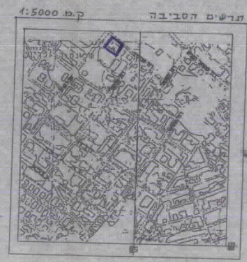
תושבים הסביבה ק.מ. 1:5000

הערות: 1. המדידה מבוססת על נקודות ממשלחיות JM/748, JM/747 2. הגבה מבוססת על נקודה עירונית מס' 2 בגבה 766.02