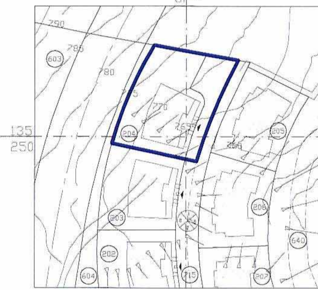
תרשים מקום. קנ"מ: 1:1250

מחוז : ירושלים נפה : ירושלים המקום : רכס חילים גוש : 30449 מגרש : 204 לפי ת.כ.נ.ג. ה.כ.ב. ב.מ.א. 110 הוכן עבור משפ' לוי רשטח 1967 מ"ר