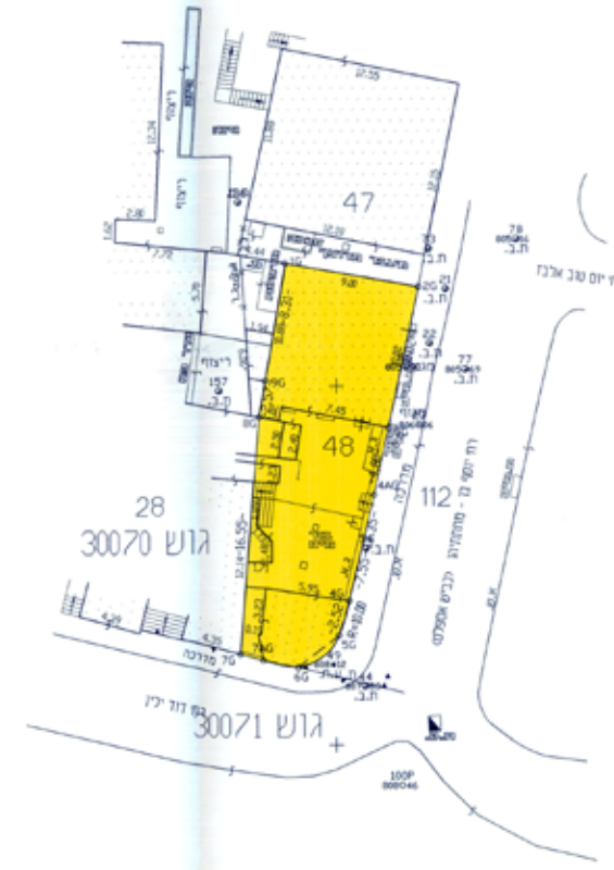
מצב מאושר ע"פ תכנית המתאר המקומית לירושלים