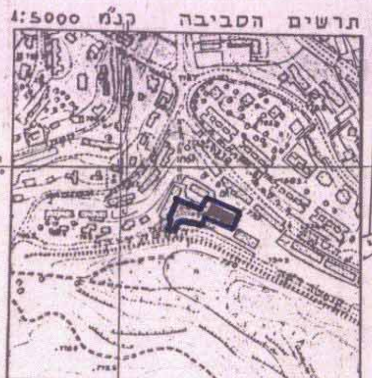
תרשים הסביבה קנה"מ 1:5000