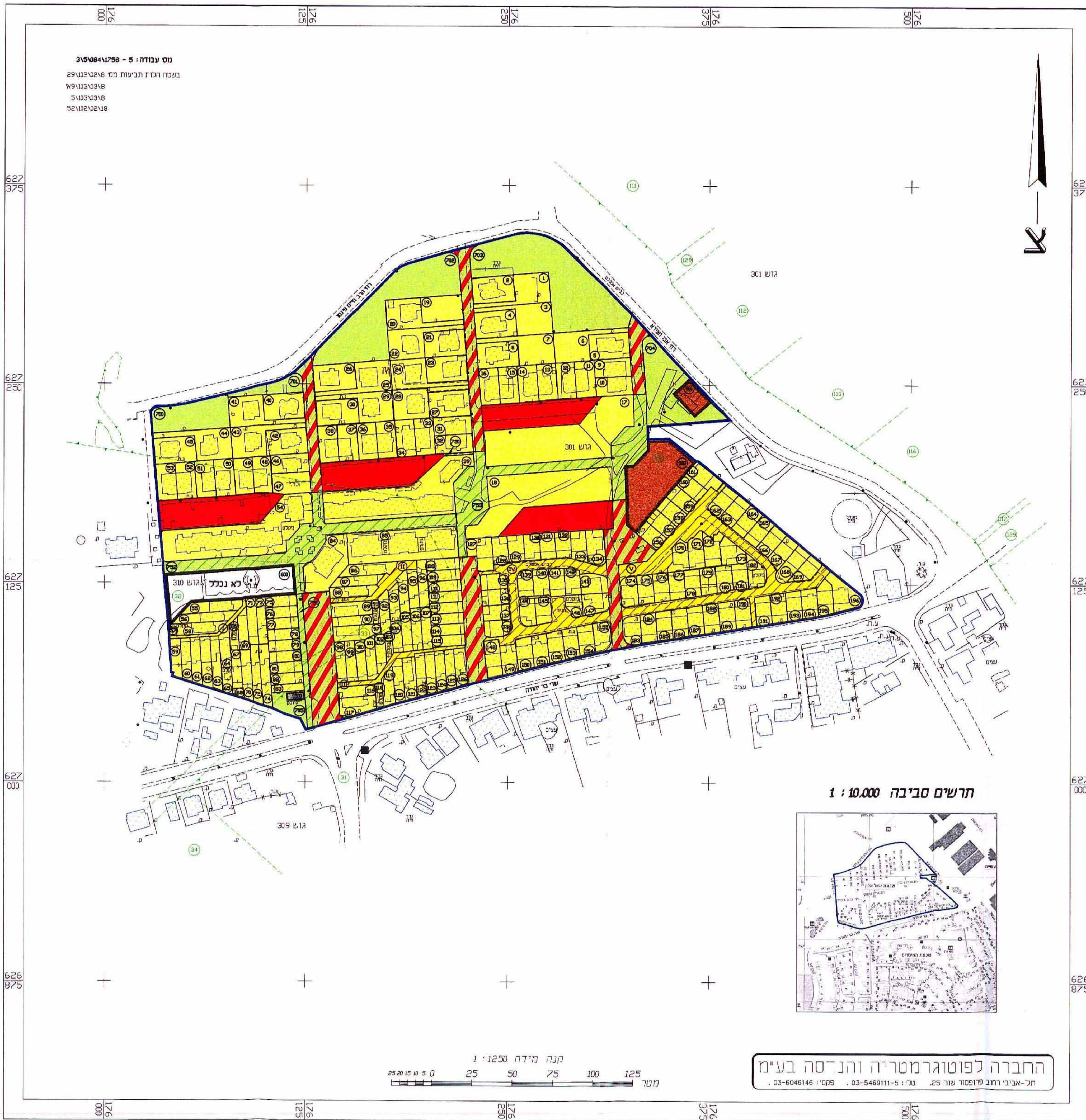
תרשים סביבה 1 : 10,000

החברה לפוטוגרמטריה והנדסה בע"מ תל-אביב רחוב פרוספור שור 25, טל': 03-5469111-5, פקס': 03-6046146