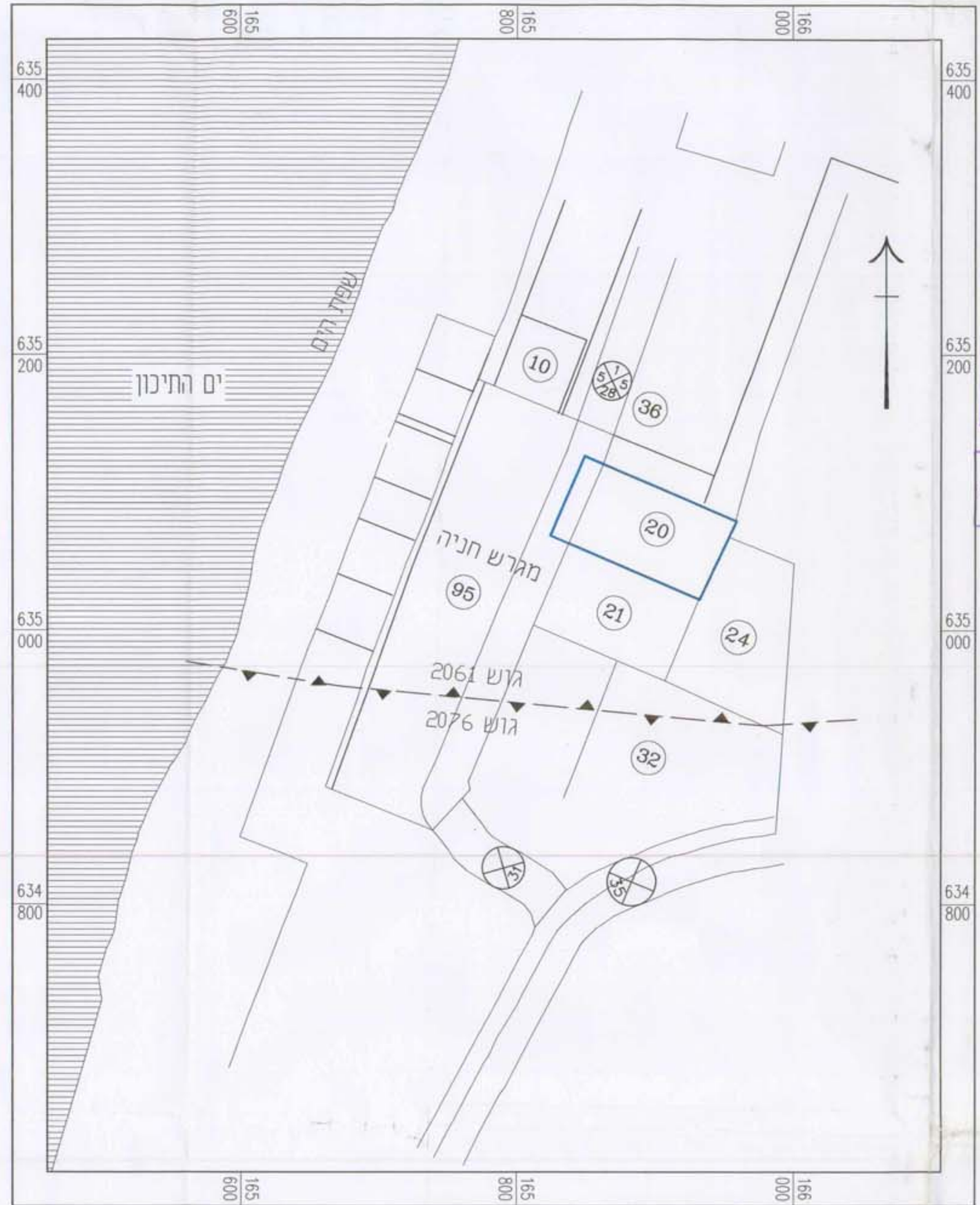
תרשימים סביבה ק"מ 1:2500