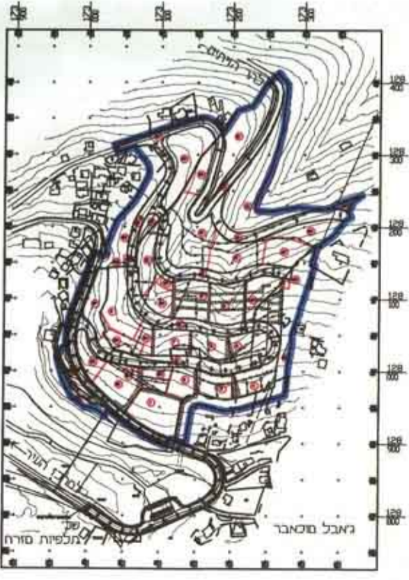
תרשים הסביבה 1 : 5000

א. מטה הפרשות לצרכי צבור בבטול התכנית מס. במ/4558 ז' הם כ- 73972 מ"ר שרם כ- 65% משטח התכנית. ב. אני יוסף קראים מודד מוסמך תחום מטה ומאשר בזאת כי חשב השטחים שבטבלת אחד וחלוקה מחדש - נכונים. בדקתי והחשב בשטחה פלנימטרית ובשטח גישתי. מודד מוסמך : יוסף קראים מס רשון 828 תחילה : מרכז מסר 148 ת.ד. 35023 ירושלים 9090 תאריך : 21.2.94 159 קרית, מודד מוסמך ירושלים 9090 מטה מסר 148 ת.ד. 35023 ירושלים 9090 טל : 02-5111118 - 02-5111118 המאריך