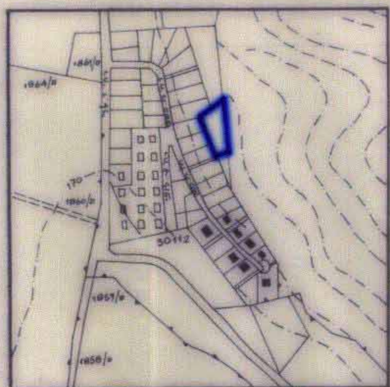
תרשים המבנה ק.מ. 1:5000