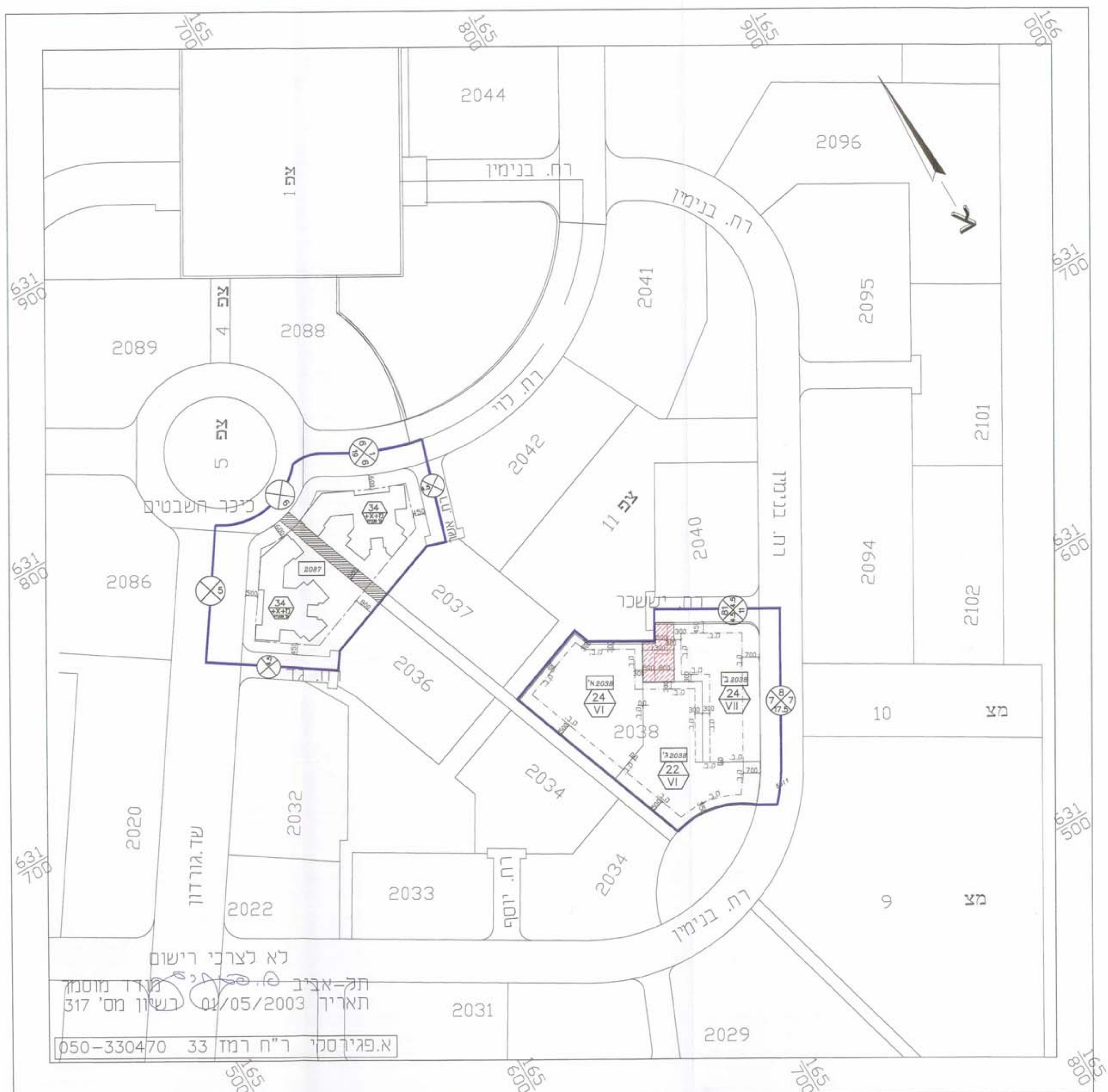
מצב מוצע ק"נ"ח. 1 : 1000