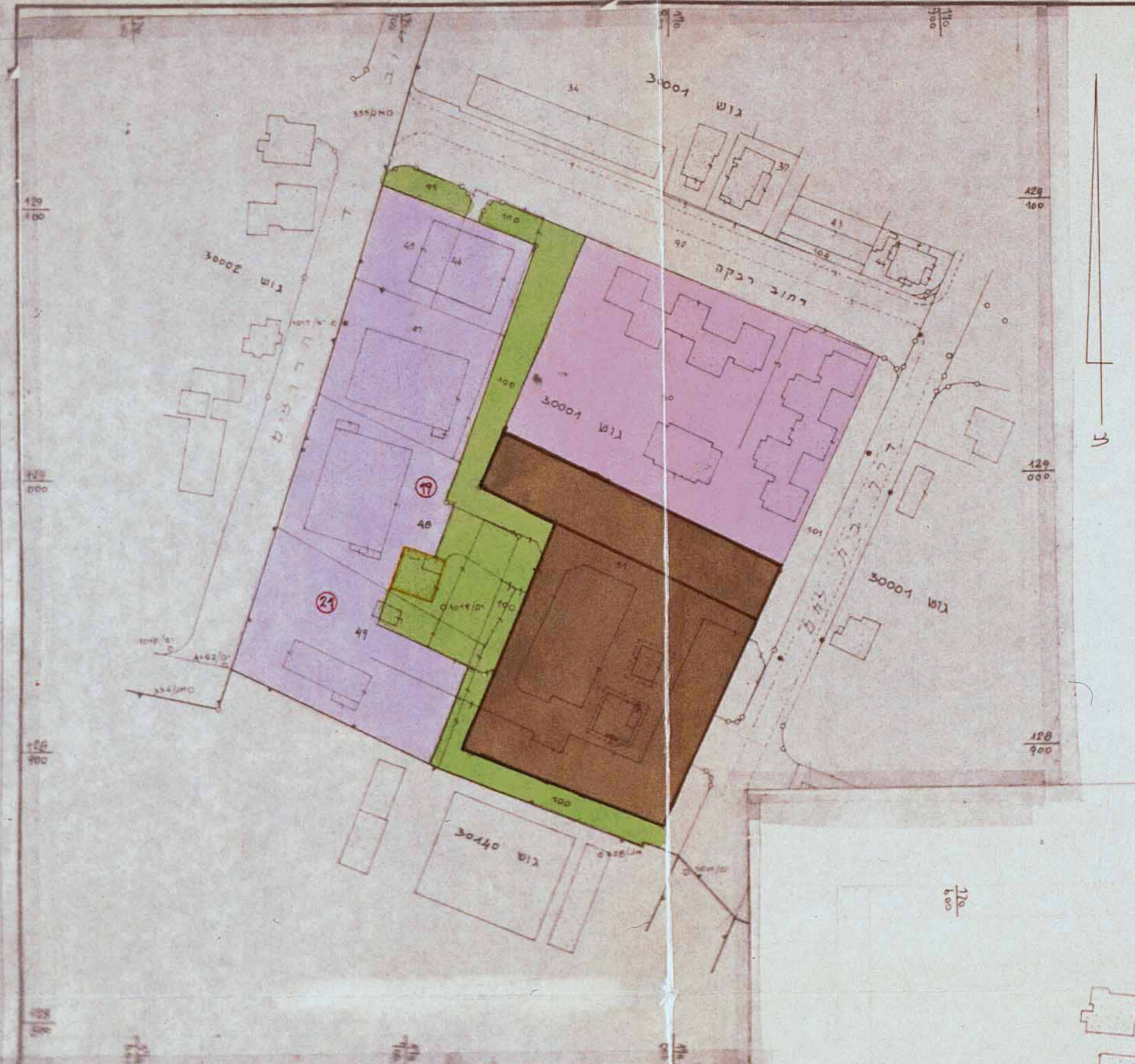
מצב מאושר לפי תכנית 1238, 1239, 124 ק.מ. 1:2500