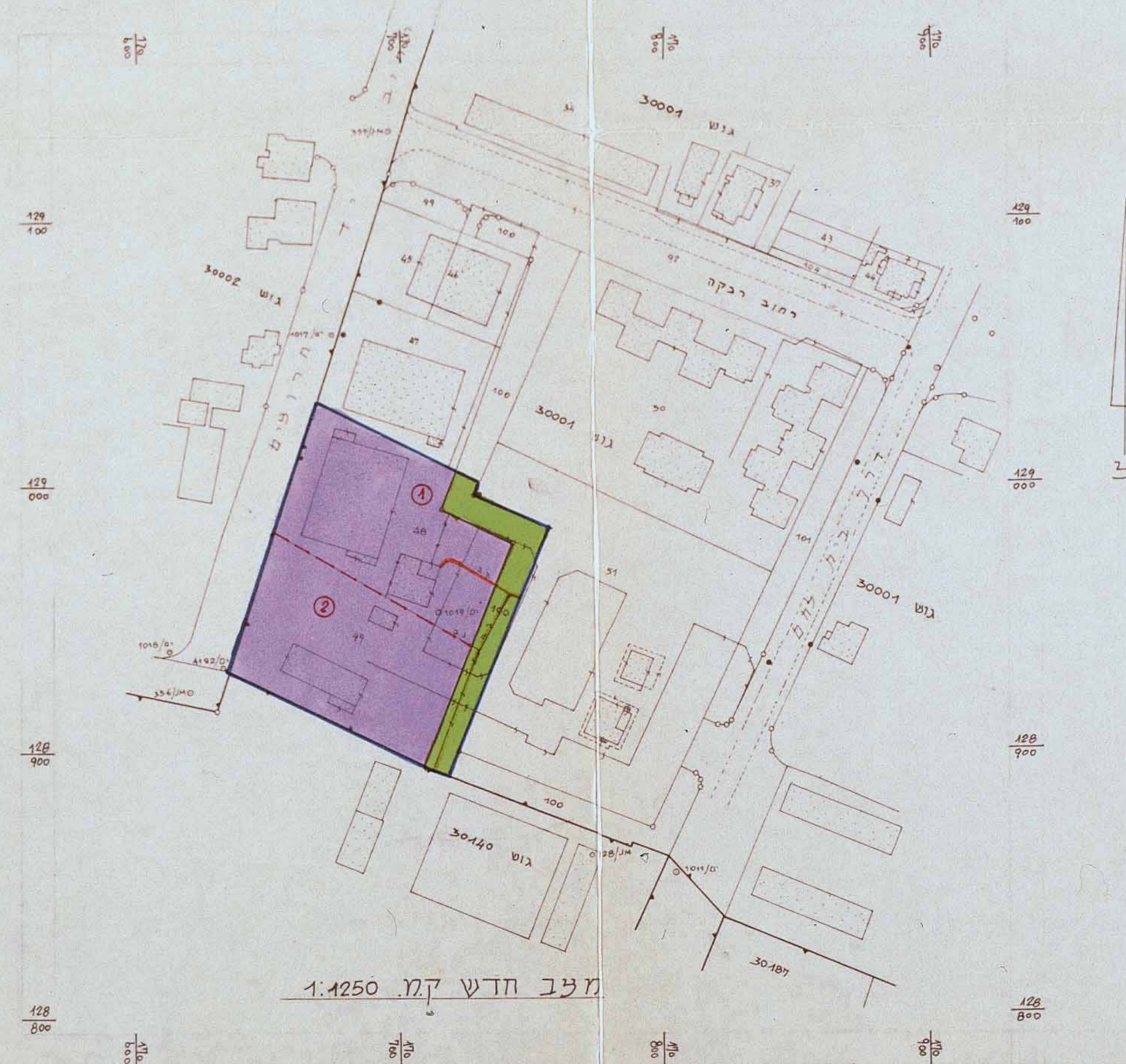
מצב חדש ק.מ. 1:1250