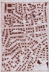
תל-ים הסביבה 50038 א