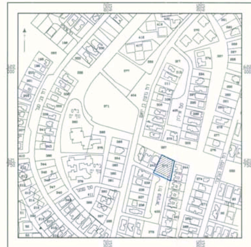
חרשים סביבה 1:5000

אלי יהלום אדריכלים ומתכנני ערים בע"מ מרכז מסחרי אמרידד-אשקלון, סניף: 08-6715336-08-6715334-08-6715334 חברה לשיכון ולפיתוח אשקלון בע"מ