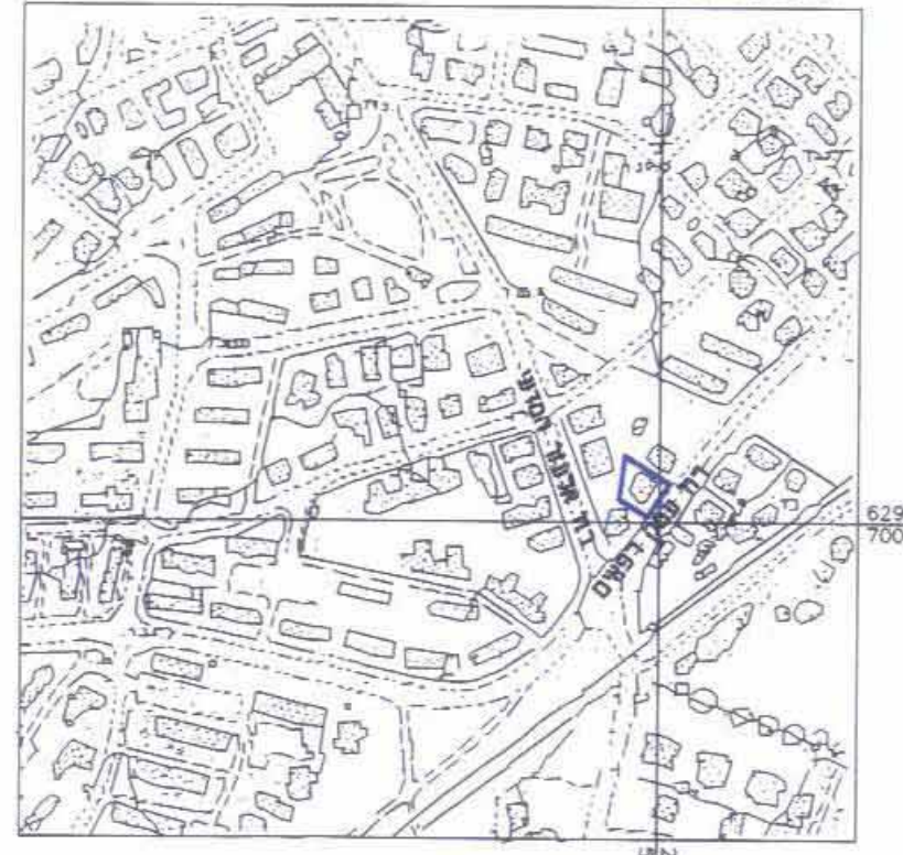
חרשים הסביבה ק.מ. 1 : 5000