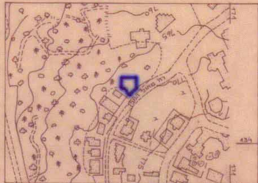
תרשים סביבה ק.מ. 1:5000