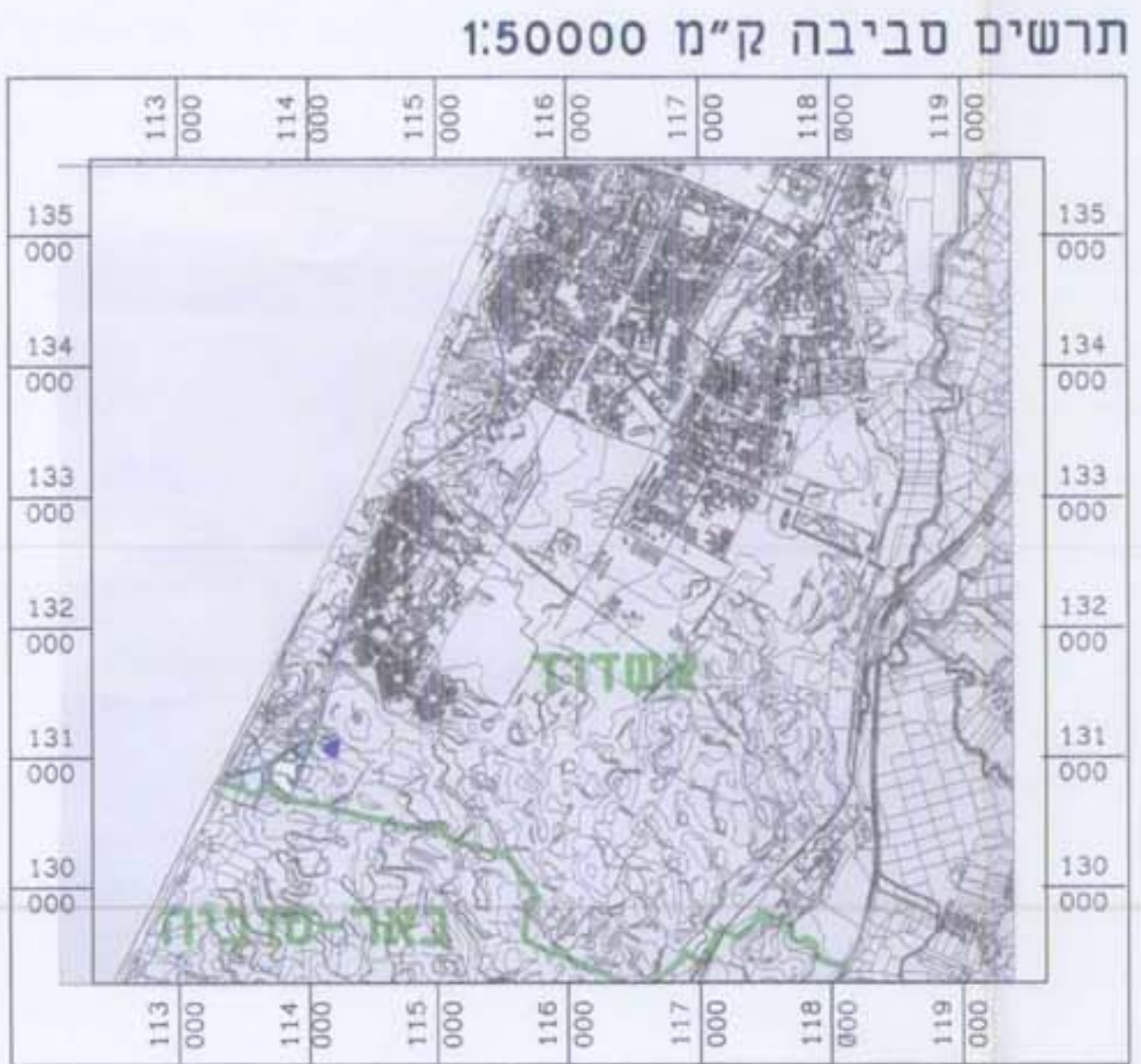
תרשים סביבה ק"מ 1:50000