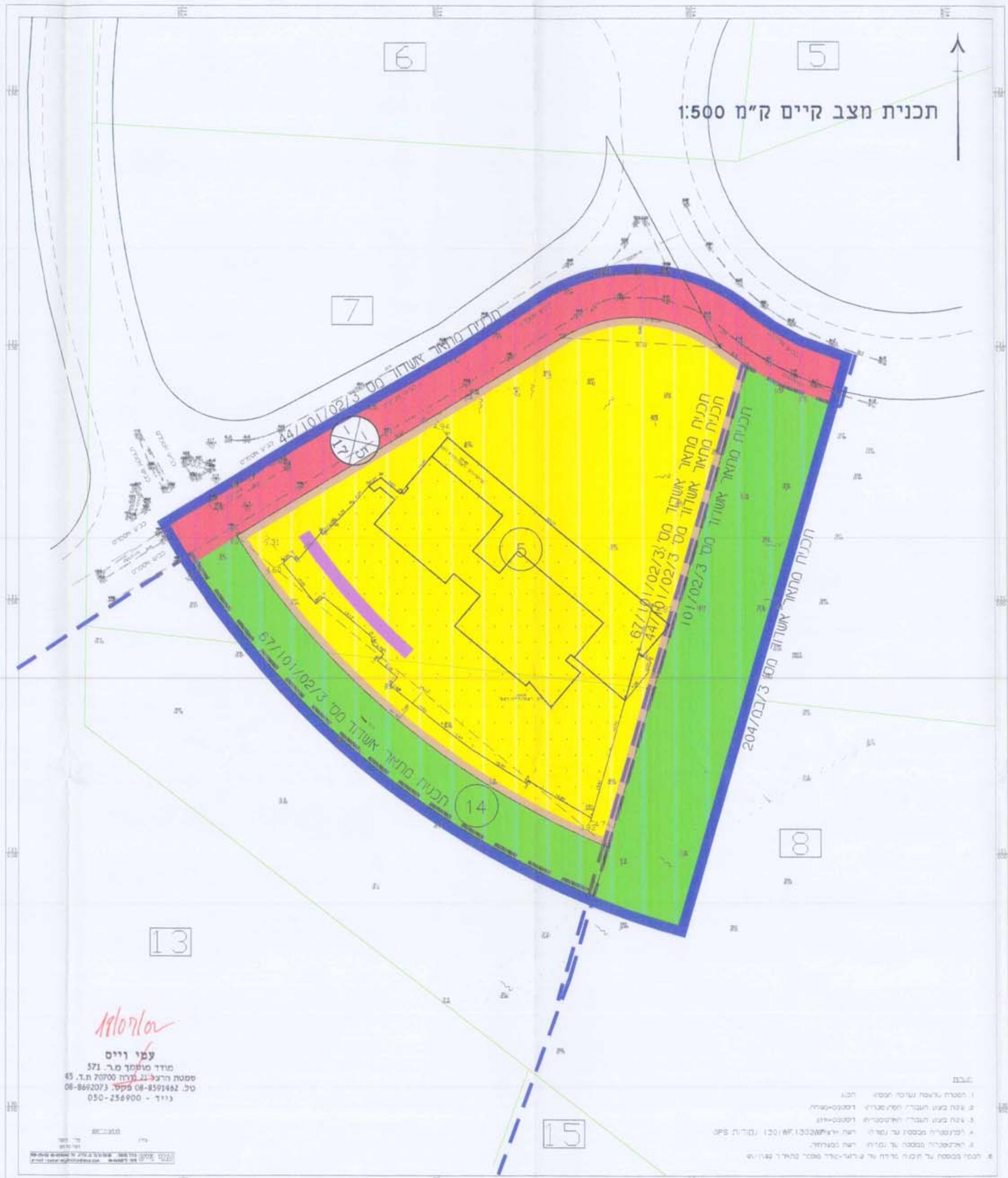
תכנית מצב קיים ק"מ 1:500