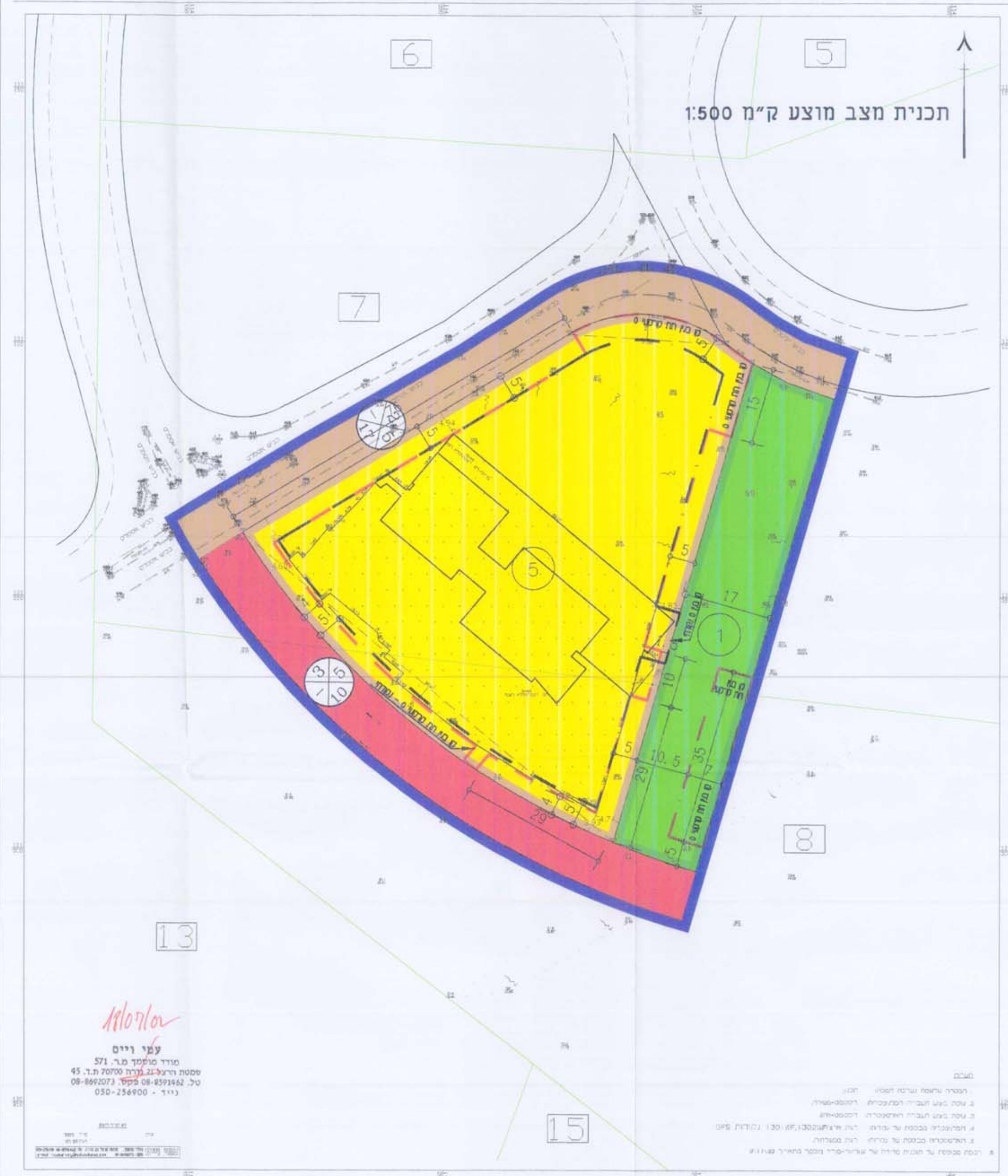
תכנית מצב מוצע ק"מ 1:500