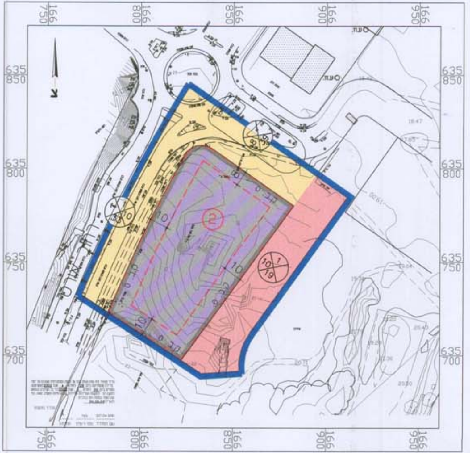
מצב מוצע קב"מ 1:1250