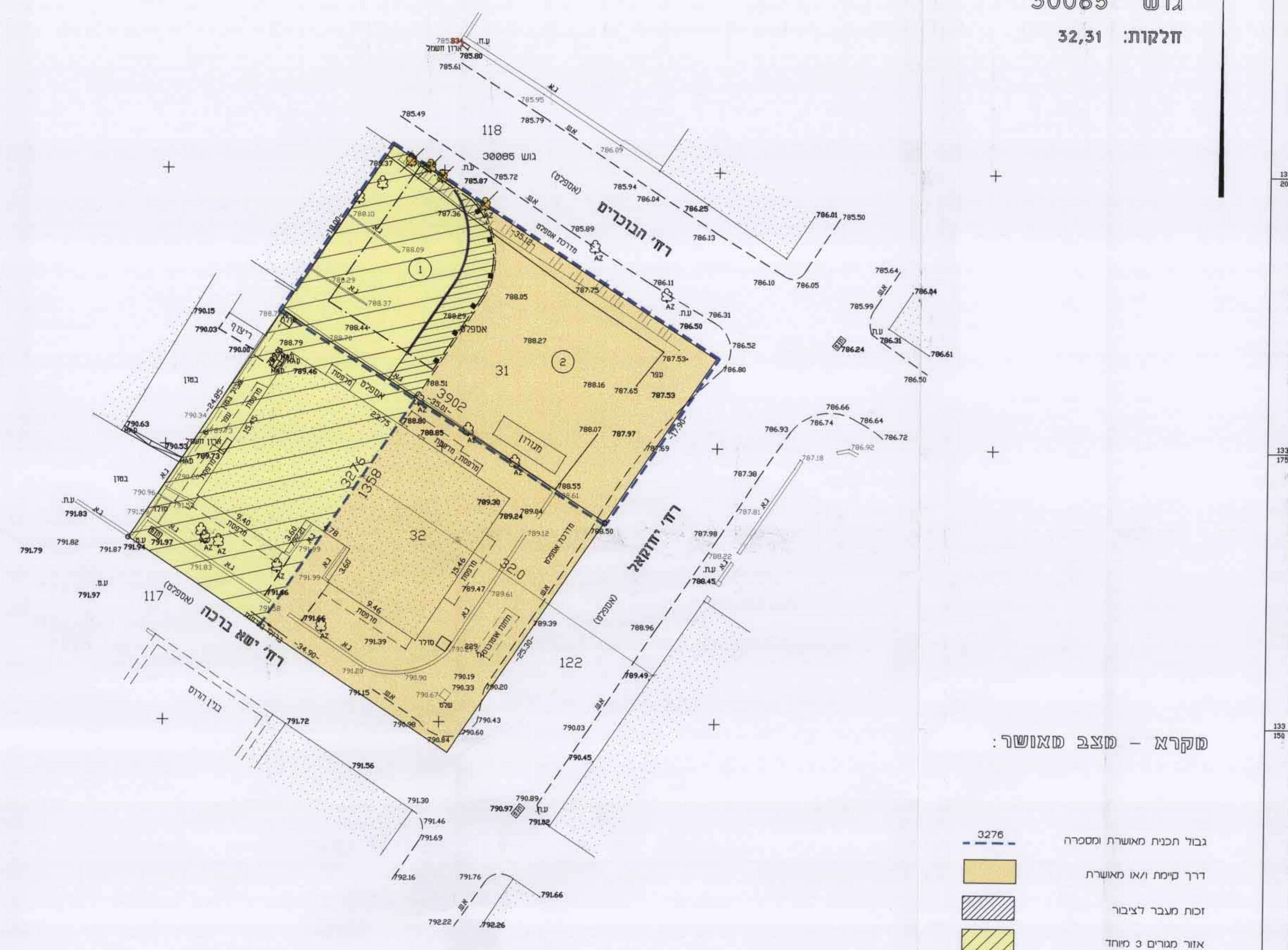
סקרא - מצב מאושר:

ירושלים - שכונת הבוכרים גוש 30085 חלקות: 32,31